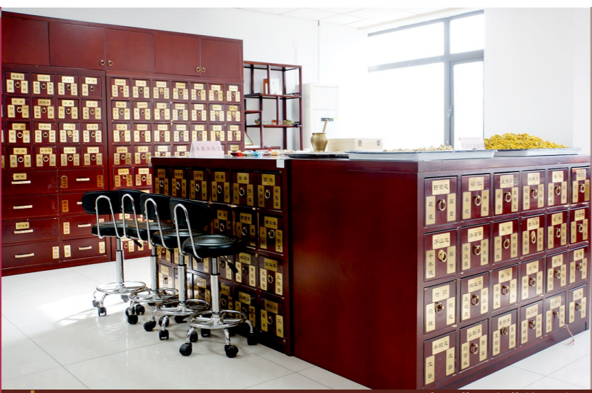
杏林药业中药体验馆。