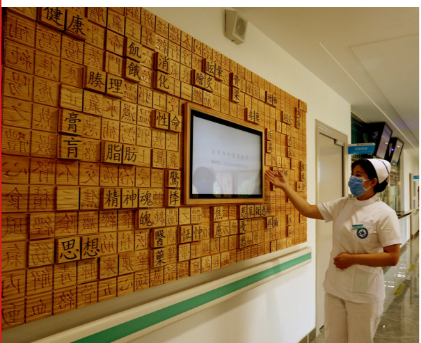
中西医结合医院宋庄院区体验馆“字里藏医”模块。

除了以上介绍的3个模块,另有8个中医科普互动模块分布在体验馆中,从多角度介绍中医历史、概念等知识。据介绍,自2022年开馆以来,中西医结合医院宋庄院区的体验馆已经接待参观互动1.3万余人次。副中心另外5个体验馆分别位于北京中医药大学东直门医院通州院区、台湖社区卫生服务中心、于家务社区卫生服务中心、牛堡屯社区卫生服务中心和半壁港社区卫生服务站。如果您恰好去这些地点就医,不妨在等候之余了解一些中医药知识。