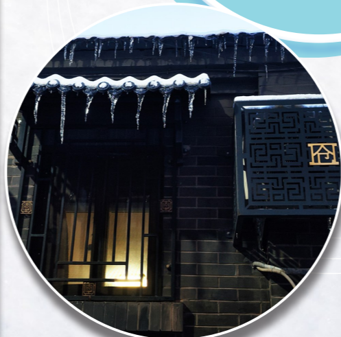
暖暖 中仓街道南大街