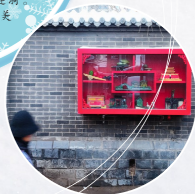
市井 中仓街道南大街