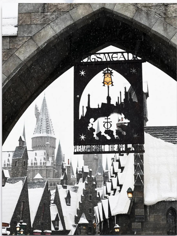
奇幻 北京环球度假区

今冬初雪，如约而至却又戛然而止。把城市副中心染白了，让北京通州更漂亮而静谧了。 月底即将全部亮相的三大建筑，大剧院、图书馆、博物馆已然接受白雪的洗礼；大运河畔、燃灯塔下、环球度假区变成了梦幻的童话世界；而通州南大街氤氲着润泽，烟火气更足，仿佛在上划开一道温柔的涟漪。 这，就是快雪后的大美通州。