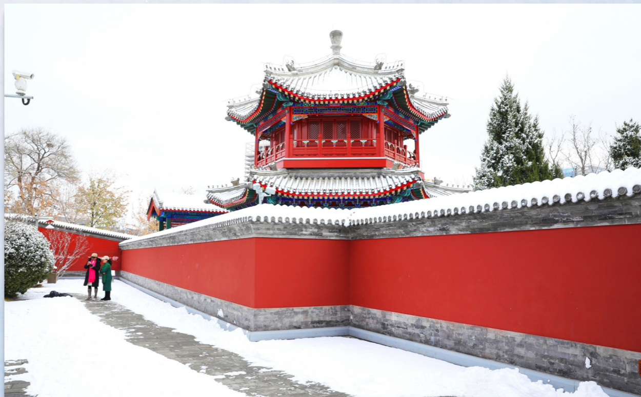
古韵 燃灯塔及周边古建筑群