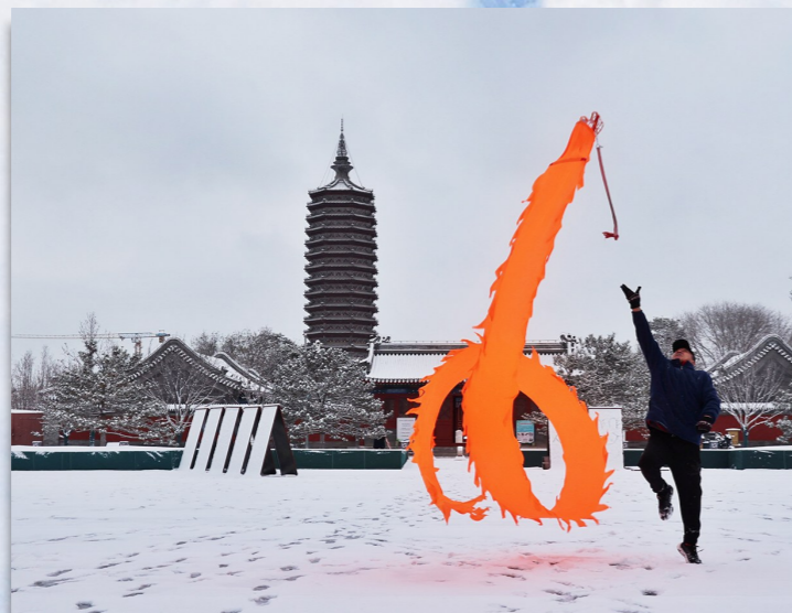
舞动 燃灯塔及周边古建筑群