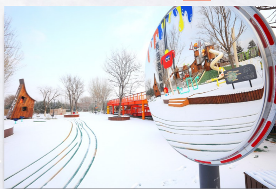
童趣 城市绿心阿派朗游玩区