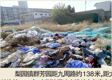
梨园镇群芳园距九周路约138米,距大稿坨约876米一大型垃圾渣土堆放点复发点位