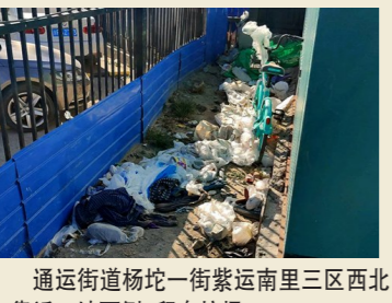
通运街道杨坨一街紫运南里三区西北角靠近工地西侧一积存垃圾