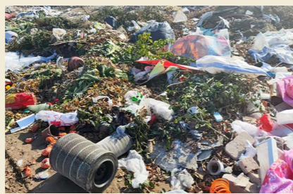
于家务乡种产业园距西马坊西路附近,距风港减河约2429米一大型垃圾渣土堆放点复发点位