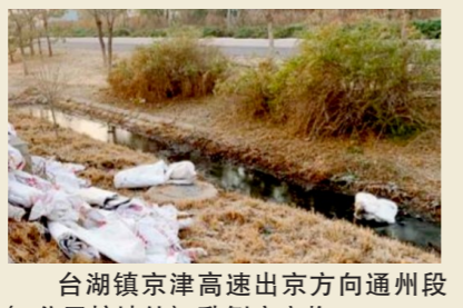
台湖镇京津高速出京方向通州段(6公里护坡处)一乱倒废弃物