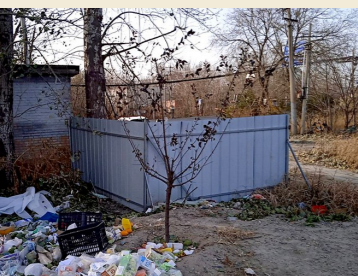
张家湾镇张风路与潮马路交叉口东南侧70米绿皮围栏后面一积存垃圾

按照市级行业标准(一级道路≤10g/m 2 ,二级道路≤15g/m 2 ,三级及街坊道路≤20g/m 2 ),在最终79个采样结果中,尘土残留量超标道路74条(其中:通州京环公司46条、乡镇25条、公路分局3条),尘土残留量超标道路5条(其中:京环公司3条,分别为中仓街道的滨河中路(中仓段)、通运街道的通胡大街、九棵树街道的通马路;乡镇2条,分别为西集镇的创益西二路,张家湾镇的四支路)。