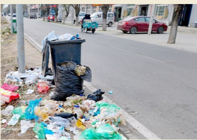
西集镇西尹路与于岳路交叉路口西130米路南一垃圾桶周边不洁