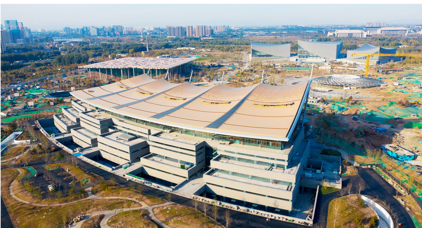
北京大运河博物馆近日顺利竣工,预计年底向公众开放。

专题展由京城系列、京津冀系列、收藏系列组成。打破常设展陈的固有窠臼,每个系列围绕专题常换常新,不断推出新的专题展览,突出北京文化、京味文化的展示,彰显古都北京的活力与创新力,辉映城市副中心定位与规划目标,弘扬北京城市文化特质与悠久传统。京城系列包括《北运河历史文化画卷专题》《畅游大运河》沉浸式数字体验