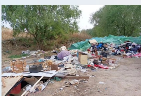
宋庄镇六合村六合村南环路449米,距运河潮减河约1443米-市级小卫星大型垃圾渣土堆放点复发点位