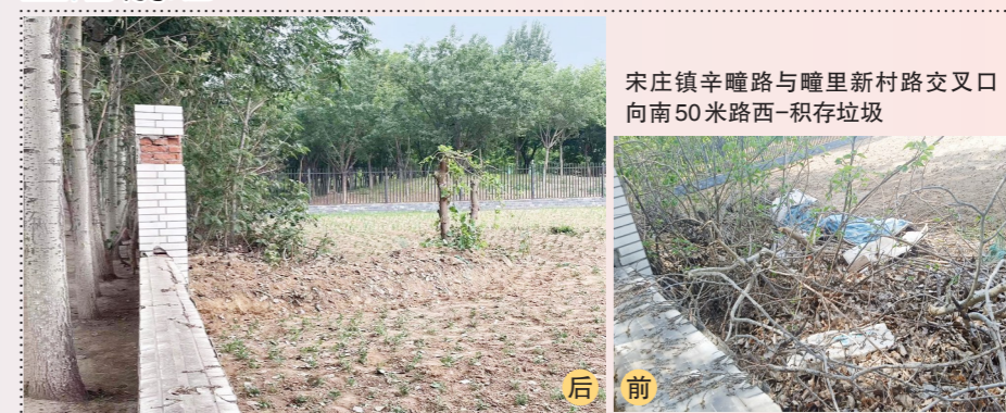
宋庄镇辛晴路与哩里新村路交叉口向南50米路西-积存垃圾