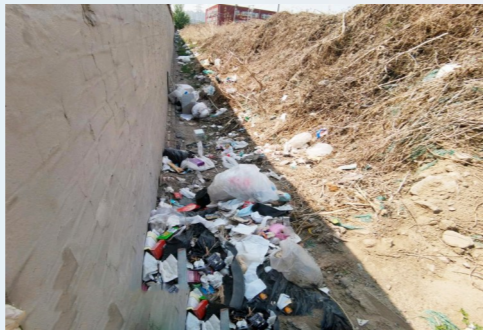
临河里街道净水斜街与梨园南街交叉口南220米-环境不洁