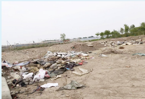
潞县镇吴营村距王楼环路约930米,距凉水河约602米-市级小卫星大型垃圾渣土堆放点复发点位