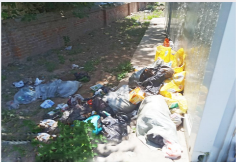
潞城镇胡郎店村生活垃圾分类暂存点旁-积存垃圾