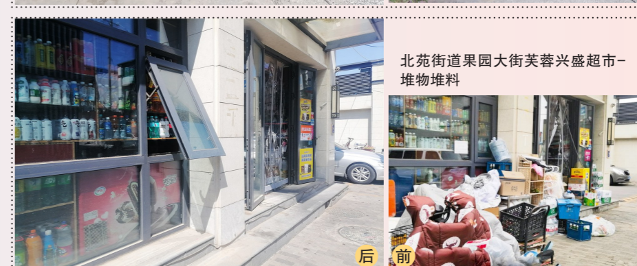
北苑街道果园大街美蓉兴盛超市-堆物堆料