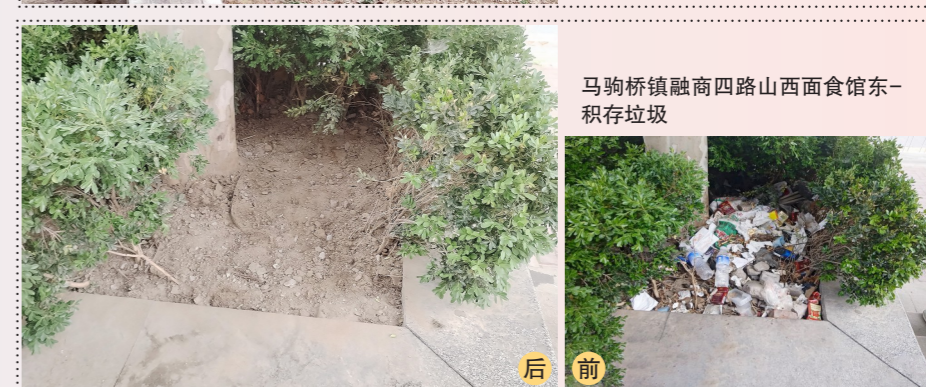
马驹桥镇融商四路西面西面馆东-积存垃圾