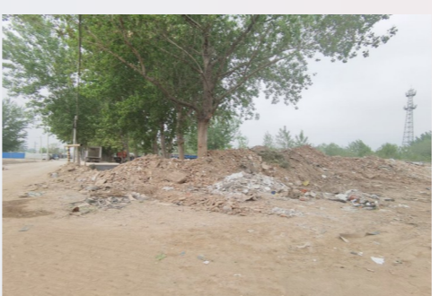
于家务乡距通房路约228米,距凤港减河约2157米-市级小卫星大型垃圾渣土堆放点复发点位