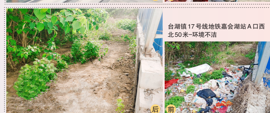
台湖镇17号线地铁嘉会湖站A口西北50米-环境不洁