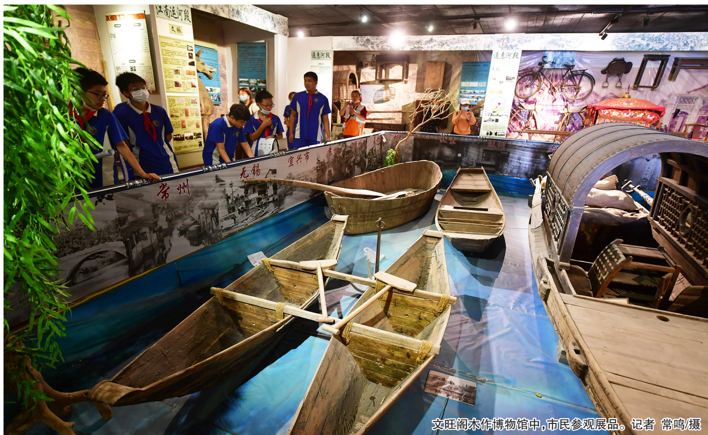
文旺阁木作博物馆中,市民参观展品。

今天是国际博物馆日,无论是博物馆知古的老物件,还是古为今用的新生态,在城市副中心,大大小小的各种类型的博物馆,都为这座千年之城涂抹上了浓郁的文化底色。