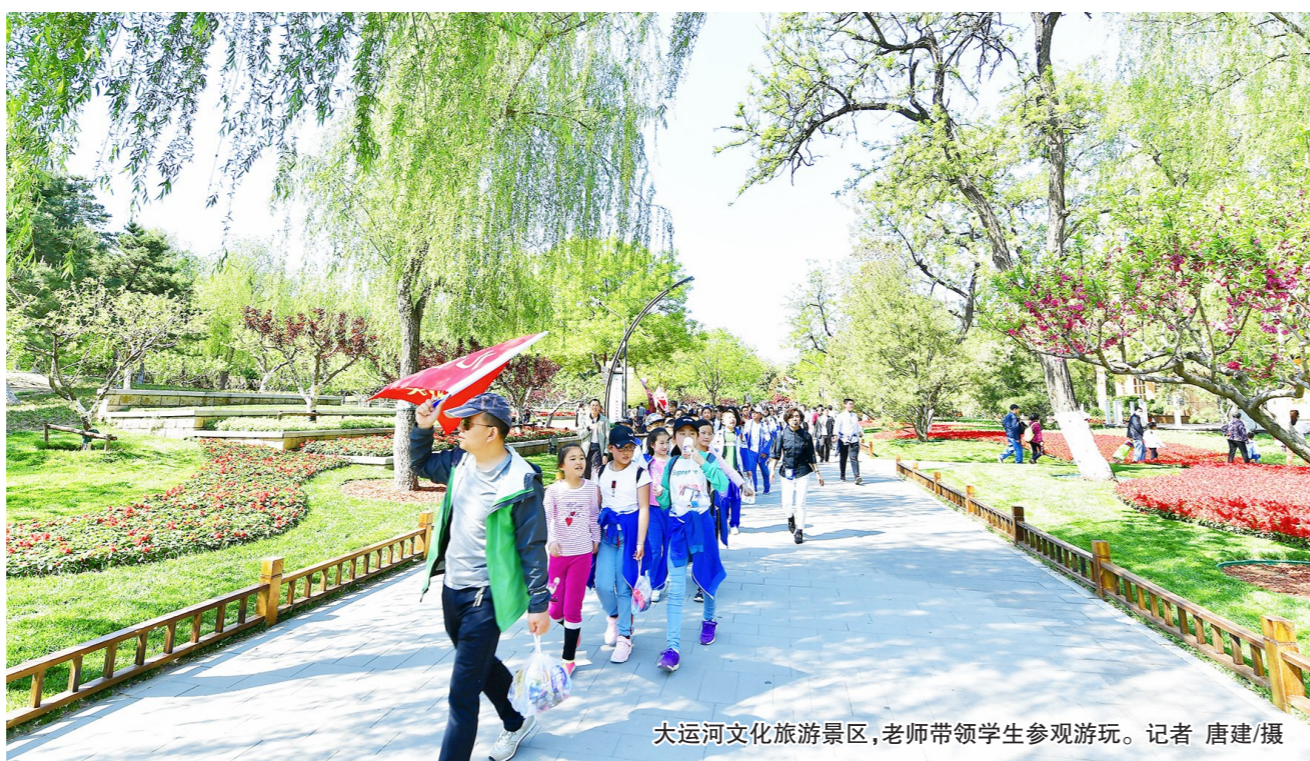
大运河文化旅游景区，老师带领学生参观游玩。

5月3日，大运河畔开展“五一”劳动节主题系列活动，综合国潮、时尚、美食等特色，打造处处有景、昼夜可游的运河水岸风光。