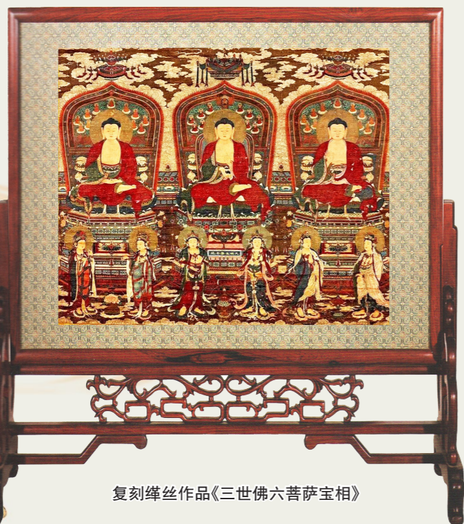
复刻缙丝作品《三世佛六菩萨宝相》