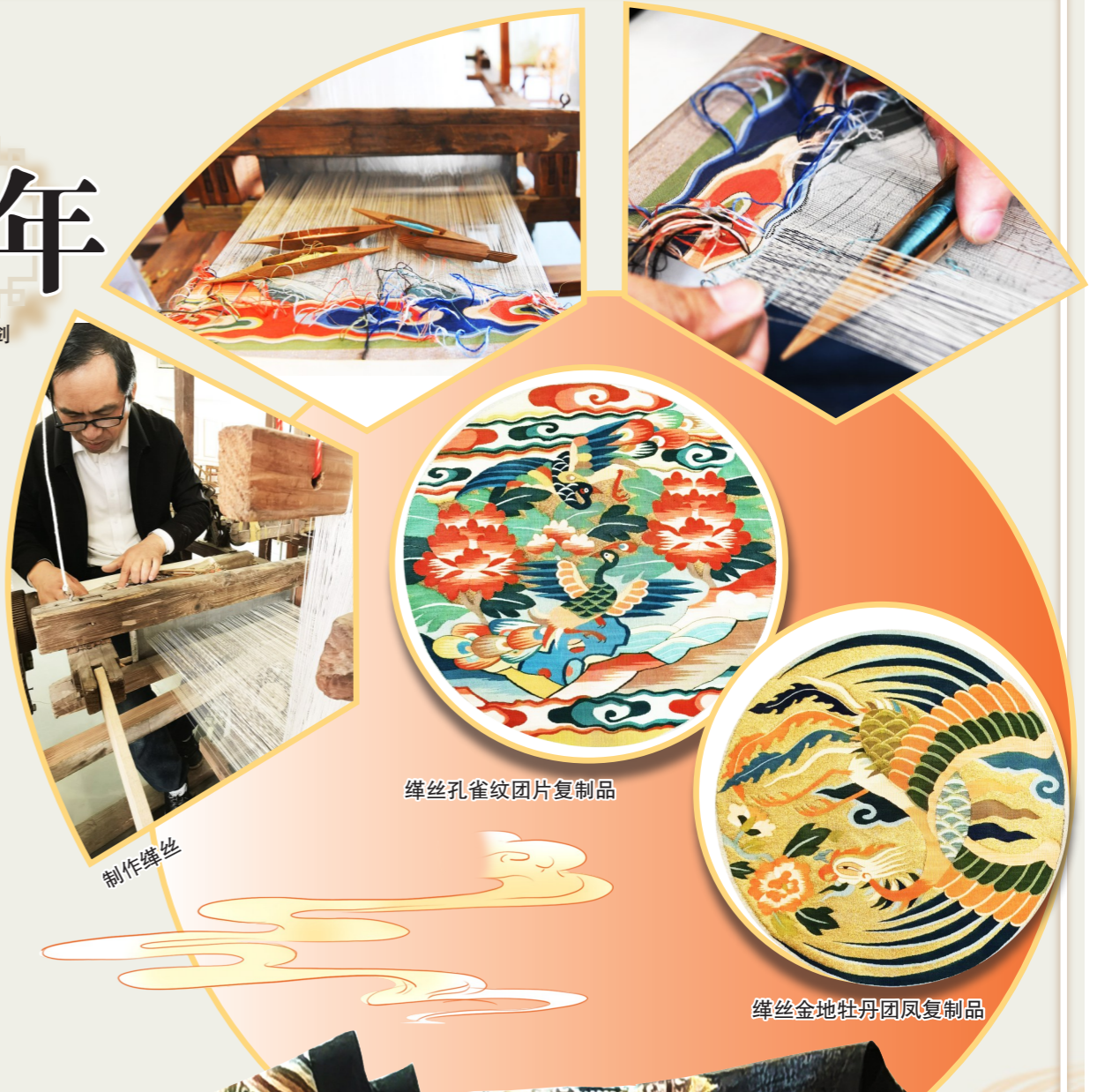
缙丝孔雀纹团片复制品

艺术馆三层还有不少小型缙丝机,“跃跃欲试”的客人可以亲手制作杯垫、被套等,老师会将繁琐的纺织技艺步骤抽丝剥茧,细细讲解,让体验者亲身体会非遗的魅力与乐趣。