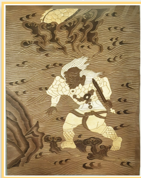
缙丝金套局部复制品