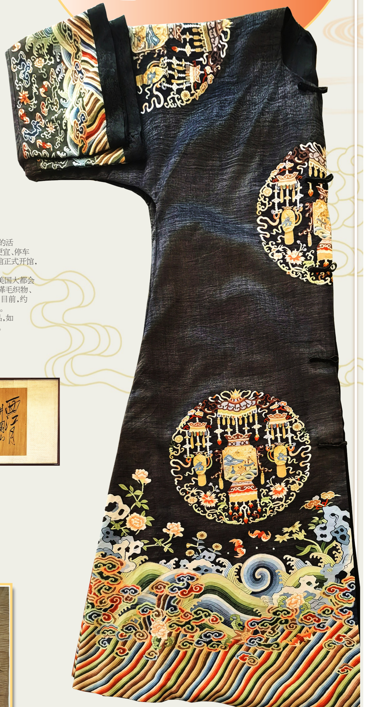
嘉庆年间石青缙丝八团庆寿灯笼纹棉褂复制品