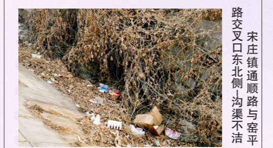
宋庄镇通顺路与密平路交叉口东北侧沟渠不洁