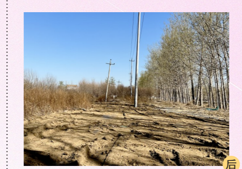
马驹桥镇距北漷路约33米,距凉水河约2938米-市级小卫星大型垃圾堆放点复发点位