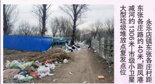
永乐店镇东张各庄村距东张各庄路口约200米-市级小卫星大型垃圾堆放点复发点位