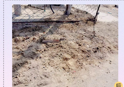
台湖镇潞西路汇利水站前一积存垃圾