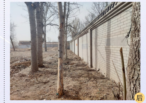
张家湾镇张采路齐善庄村口附近-环境不洁