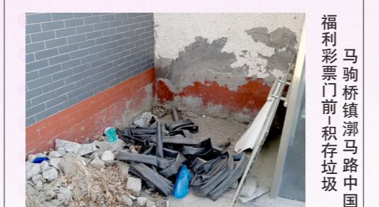
马驹桥镇漷马路中国福利彩票门前堆积垃圾