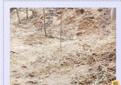
杨庄街道杨庄路与通朝大街交叉口北200米路西绿地及围挡后-积存垃圾