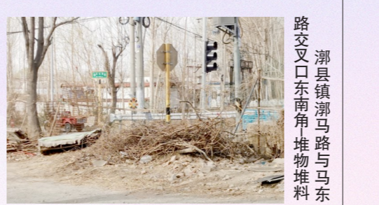
漷县镇漷马路与马东路交叉口东南角堆物堆积