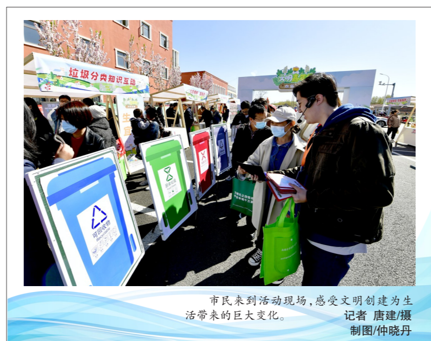
市民来到活动现场,感受文明创建为生活带来的巨大变化。 制图/仲晓丹