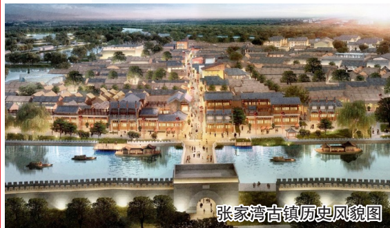
张家湾古镇历史风貌图

城墙遗址及通运桥文物保护与修缮工程主体已于去年底完工。破坏文物的各类隐患得到消除,桥石、石狮、城墙等按照“修旧如旧”原则保留了历史风貌,城墙、桥体的历史文化价值得到保护和延续。历经数百年风雨洗礼的张家湾城墙及通运桥,在今朝继续释放古朴、艺术和历史之美。