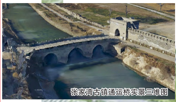
张家湾古镇通运桥实景三维图