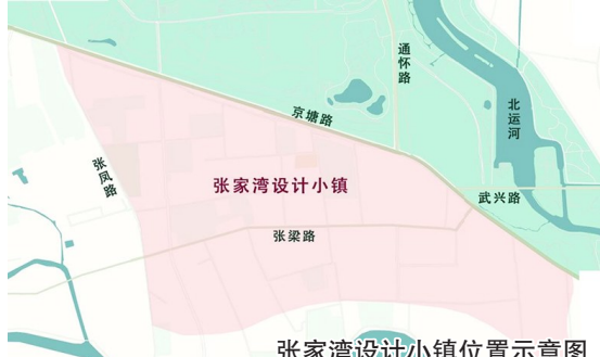
张家湾设计小镇位置示意图