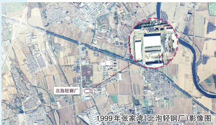
1999年张家湾(北泡轻钢厂)影像图