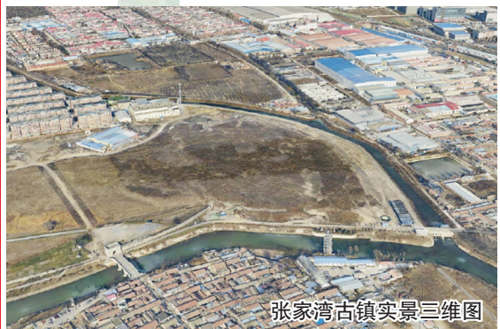
张家湾古镇实景三维图