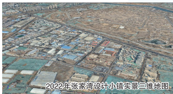
2022年张家湾设计小镇实景三维地图