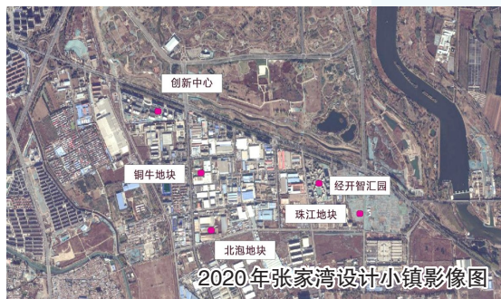
2020年张家湾设计小镇影像图

自2020年启动建设以来,张家湾设计小镇坚持规划引领,围绕城市副中心发展战略目标,聚焦创新设计和城市科技产业,持续加快存量改造、产业升级与城市更新,并在“首届北京城市更新最佳实践评选活动”中获评城市更新“最佳实践”。通过不断营造良好的创新创业生态环境,设计小镇走出了一条“产业特色鲜明、要素集聚、宜业宜居、富有活力”的特色小镇高质量发展之路,成为城市副中心的新增长引擎。