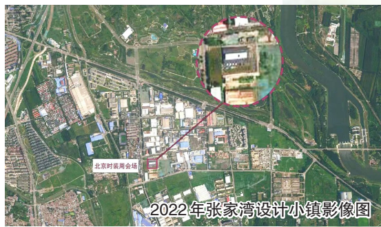
2022年张家湾设计小镇影像图