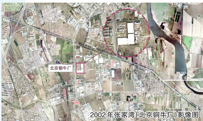
2002年张家湾(北京铜牛厂)影像图