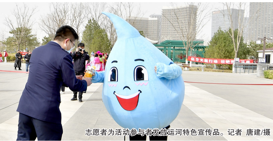
志愿者为活动参与者发放运河特色宣传品。

通州区水务局有关负责人表示,今年副中心将大力加快污水治理工程建设,实现河东资源循环利用中心一期正式运行,实施减河北综合资源利用中心项目,全面完成全区入河排污口清理整治。大力推进老城区雨污合流污染治理,完成乡镇地区排水管网污染溯源与排查评估,确保40个村生活污水治理工程竣工。