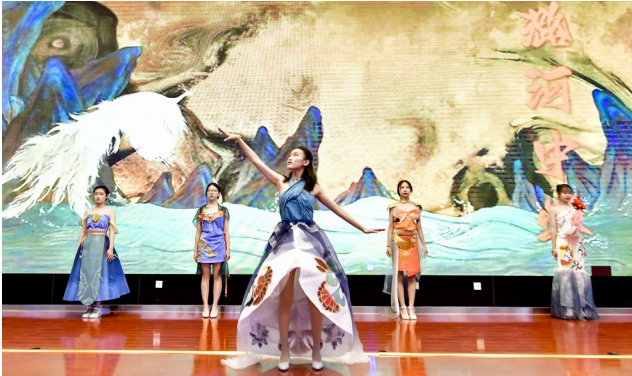
潞河中学获服装再造项目冠军。

本报讯(记者 张丽)近日,北京市中小学生技术设计创意大赛通州赛区赛事揭榜,经过激烈角逐,第一实验小学杨庄校区、潞河中学、人大附中通州校区、运河中学和中山街小学分别获得魅力校园、服装再造、月球探密、挑战极限和水球大战项目的冠军。