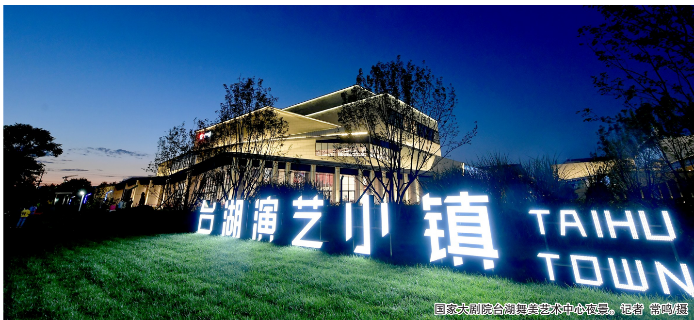
国家大剧院台湖舞美艺术中心夜景。

别小瞧了这里的农业，过去，台湖农业的确做出了名堂。比如“番茄联合国”“稻田蟹”“清水稻”等，都曾是响当当的品牌。“和北京传统干旱农业不同，台湖地区自古至今水源都很丰富，北有萧太后河、东南有凉水河，水源充足、土质肥沃、土壤深厚，为