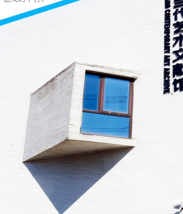
宋庄当代艺术文献馆

宋庄当代艺术文献馆是一个具有文献收藏、研究、保存、分享,同时兼有展览、公共教育等服务功能的非营利性的专业艺术机构。文献馆全面记录中国当代艺术的发展历程,并依托宋庄艺术区,为整个宋庄乃至国际国内艺术区、艺术群落、艺术机构和艺术家个体建立一个更厚重、更有长远意义的平台。