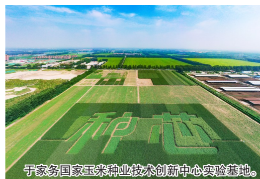
于家务国家玉米种业技术创新中心实验基地

永乐店新市镇重点加快产业转型升级,同步推进综合配套设施建设,超前布局,构建承接功能疏解的基础框架,打造京津发展轴重要节点。