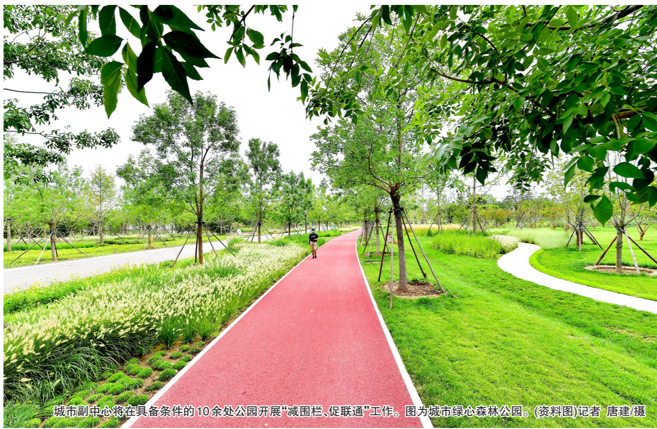
城市副中心将在具备条件的10余处公园开展“减围栏、促联通”工作。图为城市绿心森林公园。(资料图)

“我们将坚持以推进绿道生态网络建设为主线,贯穿北运河、通惠河、减河,串联大运河文化旅游景区、城市绿心森林公园、减河公园等公园,率先实现公园绿地‘无围栏’试点建设,让市民更便利地入园,让绿地相连。”该局相关负责人表示。