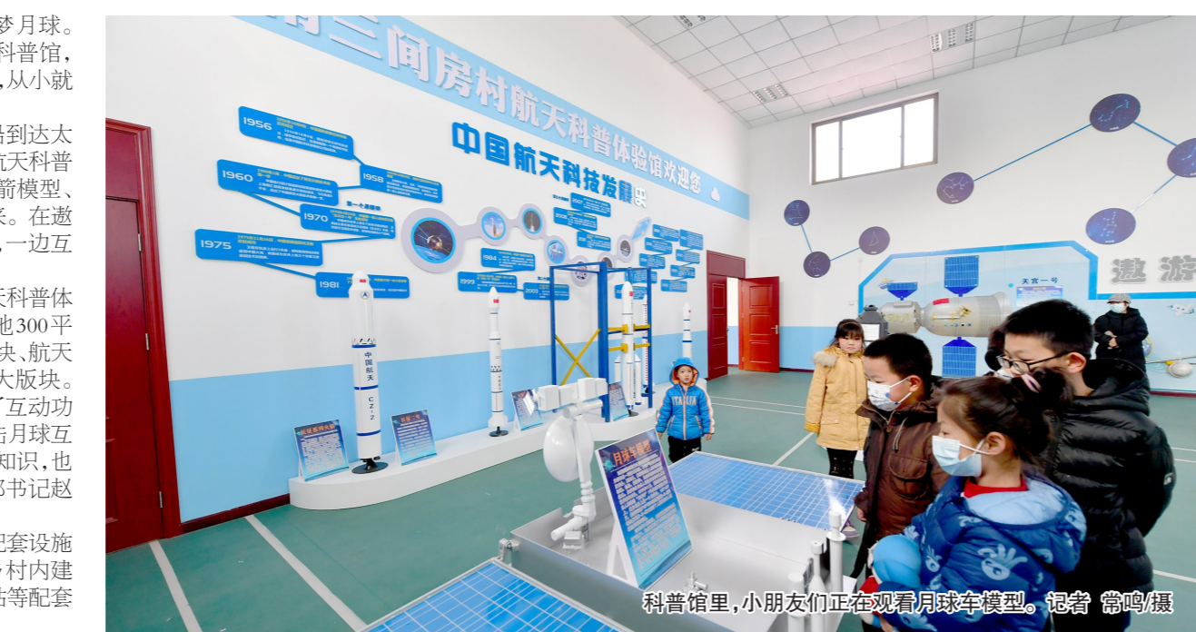
科普馆里,小朋友们正在观看月球车模型。

近年来,于家务乡不断改善农村基础设施,推动乡村振兴高质量发展,先后在乡村内建成街心公园、生态停车场、村史馆、老年驿站等配套设施,进一步扩大村民生活半径。