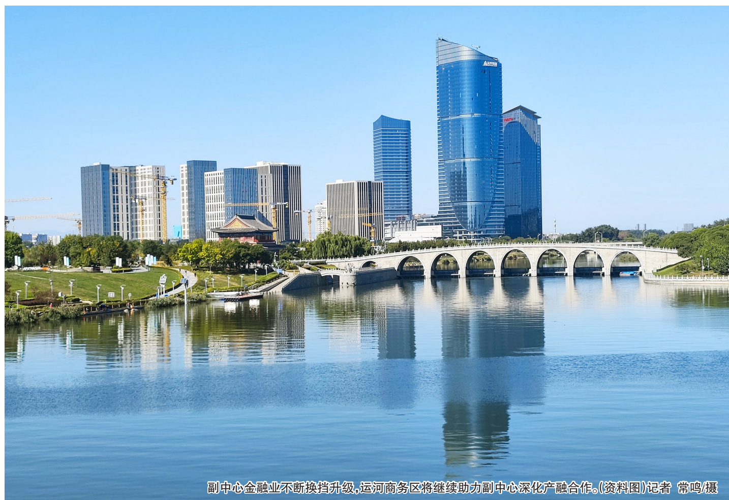
副中心金融业不断换挡升级,运河商务区将继续助力副中心深化产融合作。(资料图)记者 常鸣摄

加快建设通州区与北三县一体化高质量发展示范区,组建管理机构,健全工作运行机制。(下转2版)