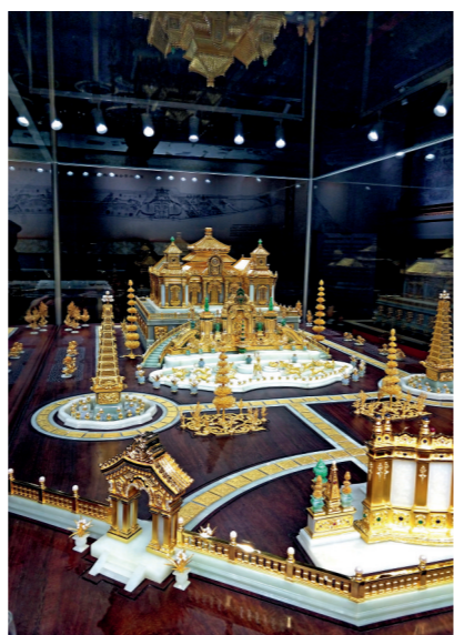
花丝镶嵌作品《圆明园大水法》

1958年以来,该厂自行研制了煤气发生炉、高频熔金炉、烘蓝炉、轧丝机、研磨机、激光焊接机等一批先进设备,在继承前人“花丝”“镶嵌”传统工艺的基础上,又发展为花丝、烧蓝、镀金等多种手工艺品种,并与牙雕、木雕、玉雕等工艺相结合,生产出花色品种各异的戒指、别