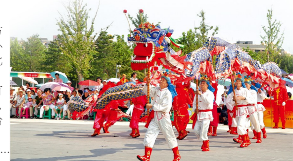
北京,通州,运河龙灯会。

新中国成立以来,里二泗小车会逐渐走向世界,参加了奥运圣火传递、2008北京奥运会开幕式和闭幕式。