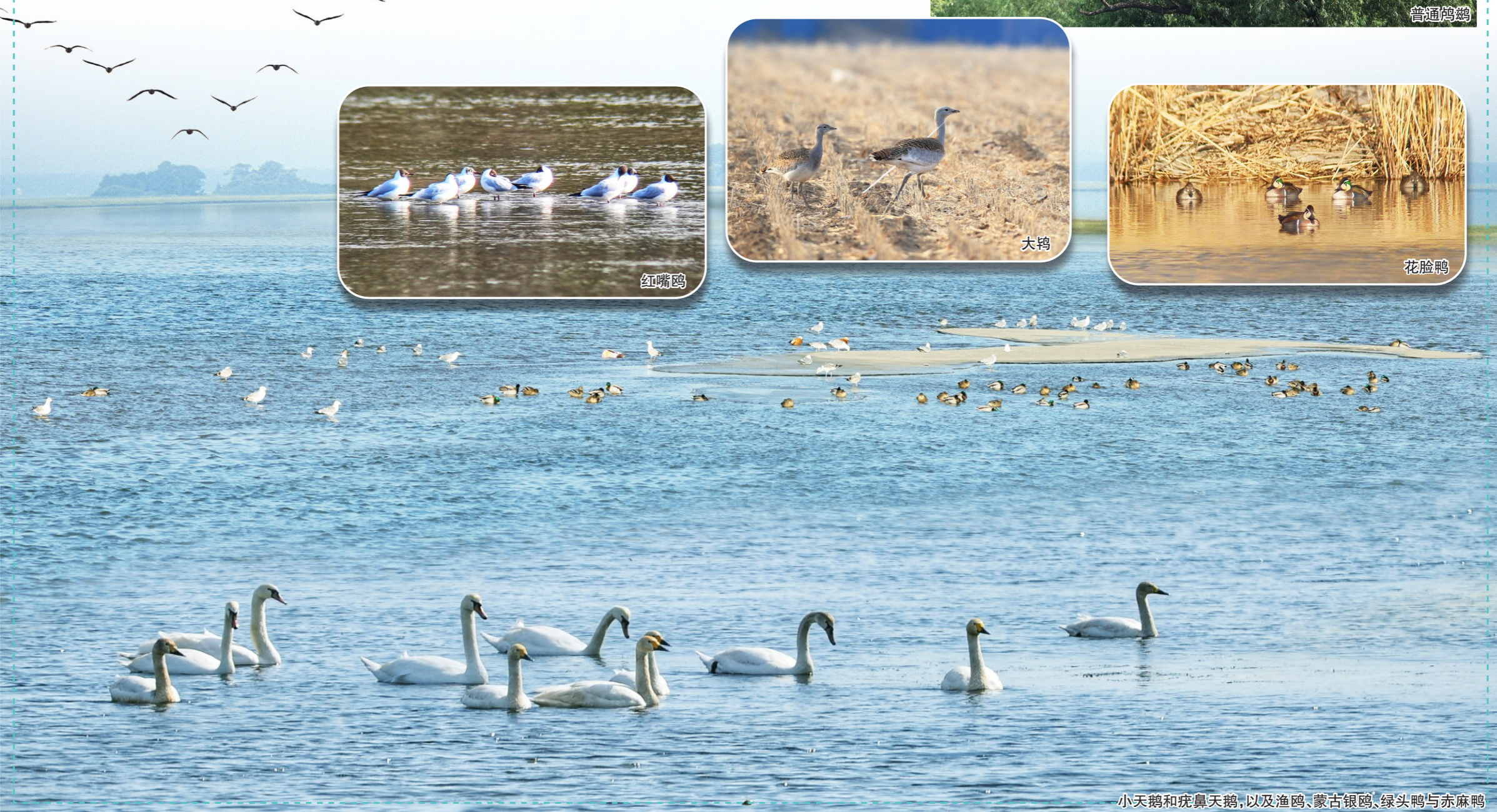
小天鹅和疣鼻天鹅，以及渔鸥、蒙古银鸥、绿头鸭与赤麻鸭