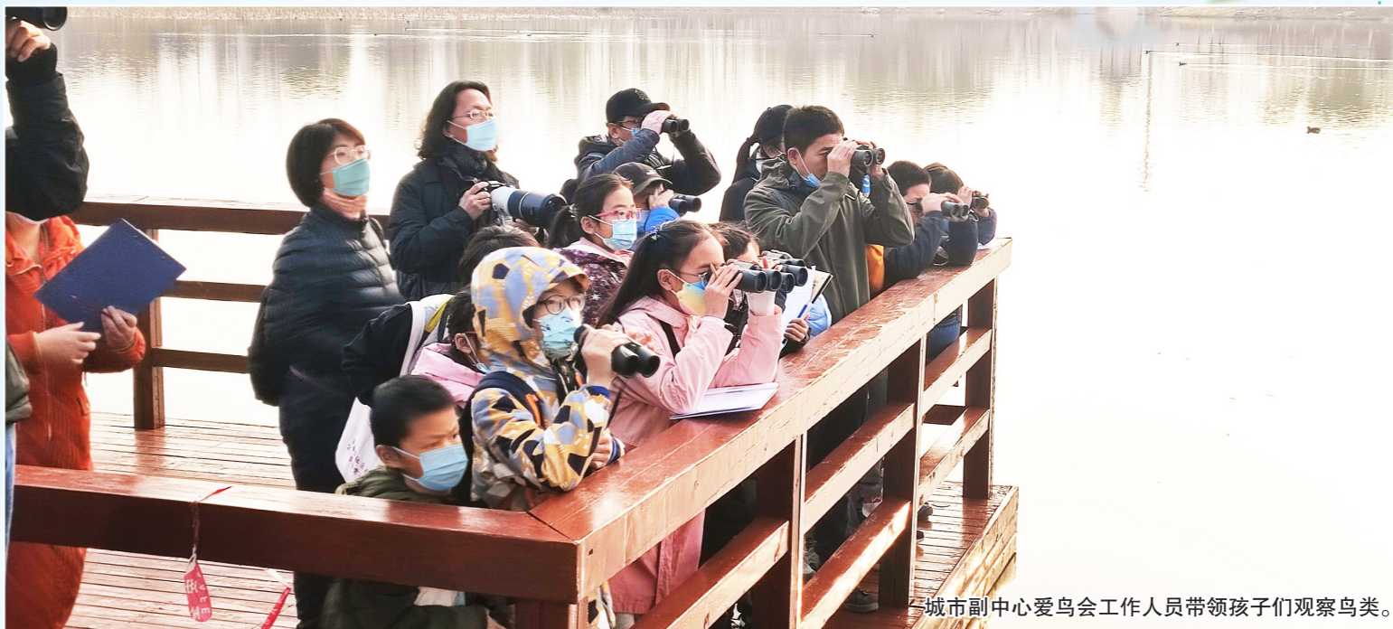
城市副中心爱鸟会工作人员带领孩子们观察鸟类。

不仅如此，爱鸟护鸟的青少年、志愿者还通过制作动画等形式，宣传鸟类保护知识。羿健说：“比如他们会通过动画描绘出白色垃圾对鸟类的危害，还有人通过海洋问题，联想到候鸟保护，随着保护意识越来越强，我相信我们和鸟类共同的家园也会越来越美丽。”