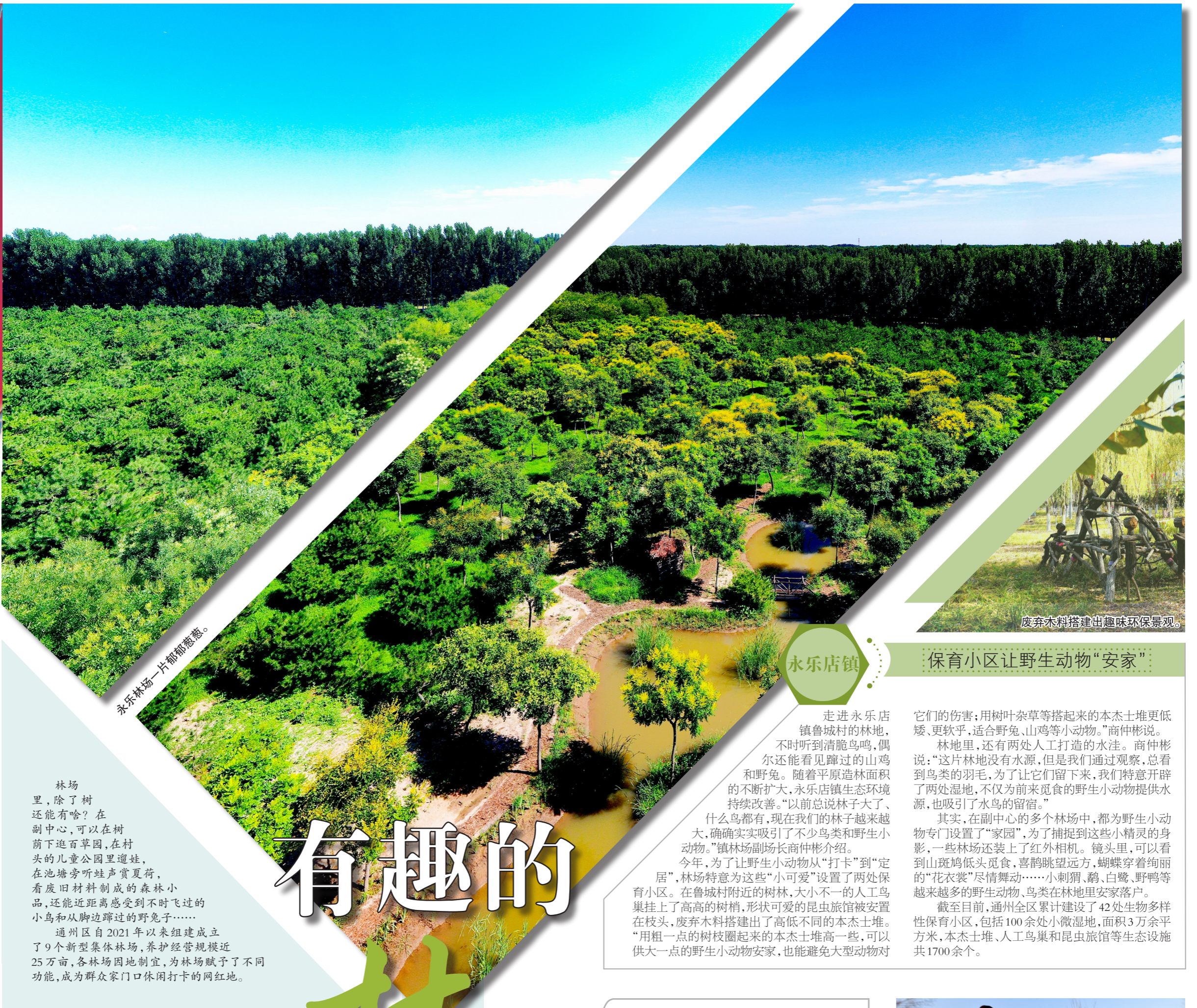
永乐林场一片郁郁葱葱。