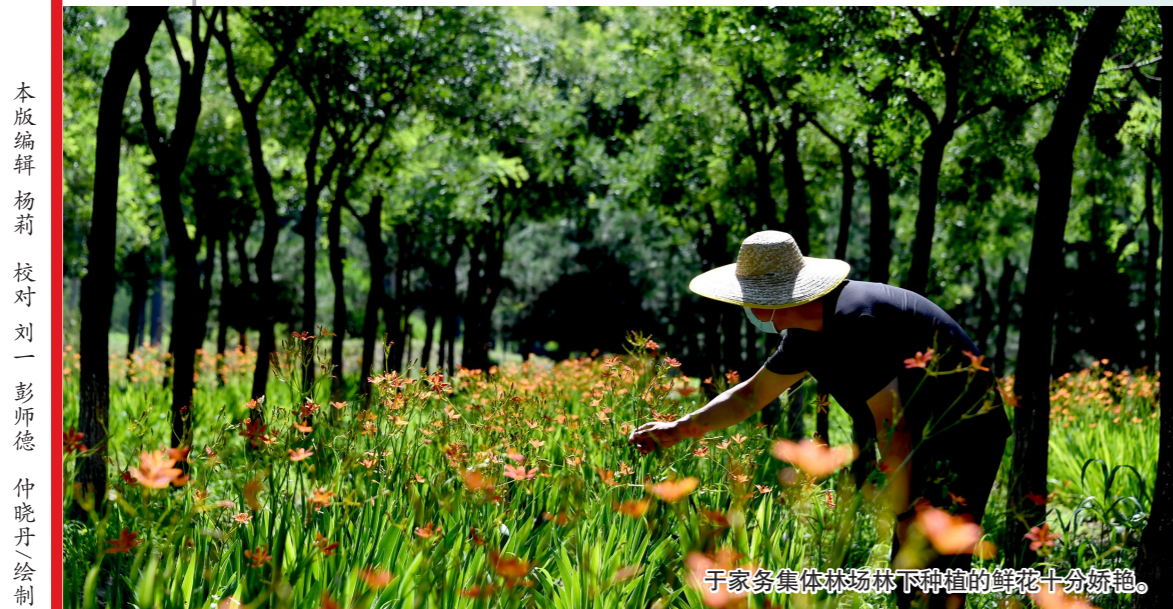
于家务集体林场林下种植的花十分鲜艳。