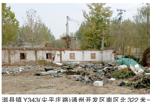
潮市镇Y343(尖平庄路)通州开发区南区北322米-积存垃圾