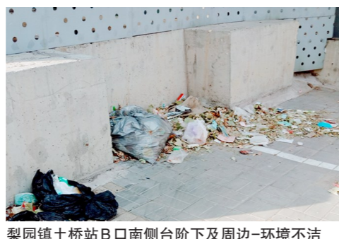
梨园镇土桥站B口南侧台阶下及周边-环境不洁