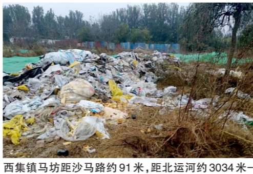
西集镇马坊距沙马路约91米,距北运河约3034米-市级小卫星大型垃圾渣土堆放点复发点