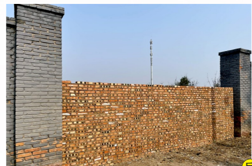
宋庄镇辛店村距兴里路约18米,距潮白河约1462米-市级小卫星大型垃圾渣土堆放点复发点