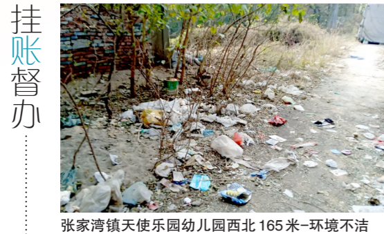
张家湾镇天使乐园幼儿园西北165米-环境不洁