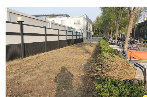
潞源街道都家府站B口北侧-环境不洁