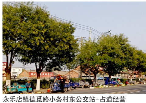
永乐店镇德宽路小务村东公交站-占道经营