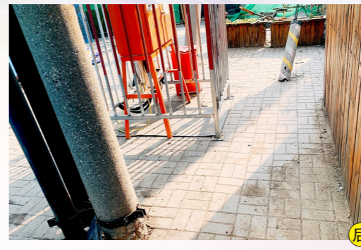
中仓街道三官庙街水月院18号生活垃圾分类投放点-积存垃圾