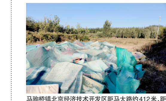
马驹桥镇北京经济技术开发区距马大路约412米,距凉水河约2410米-市级小卫星大型垃圾渣土堆放点复发点