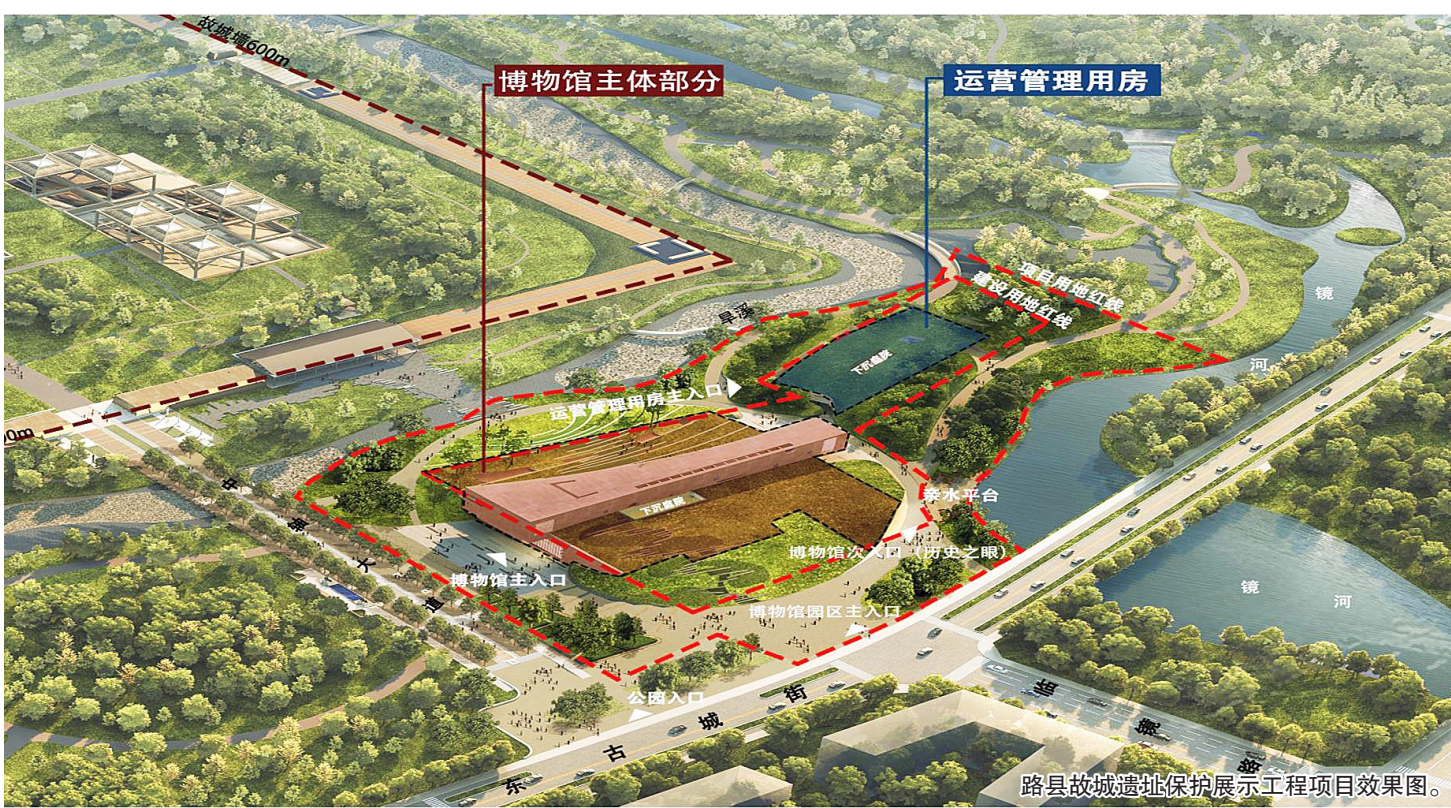
路县故城遗址保护展示工程项目效果图。

两千年前的路县故城将以怎样的面貌与我们相见?记者了解到,融合遗址保护、考古发掘、文化传承、生态建设和景观美化,建设一座大型历史类博物馆。 据介绍,该项目位于路县故城考古遗址公园内,东古城街北侧,遗址公园主轴线东侧,镜河西侧。由博物馆和运营管理用房两栋建筑组成,总建筑面积约20130平方米,其中地上建筑面积约8500平方米,地下建筑面积约11630平方米。主要建设藏品库区、藏品技术区、展示陈列用房、教育与公共服务用房、业务与研究用房、行政管理、附属用房等。