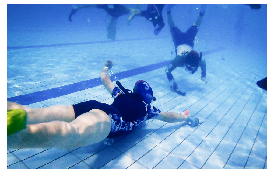
水下曲棍球项目与副中心联系紧密。北京水球队青少年、成年人训练基本都在副中心完成。(资料图)记者 常鸣摄

水下曲棍球项目与副中心的联系可谓是非常紧密。北京青少年队训练基地不仅设立在副中心,通过与本地健身企业合作,副中心还成立了首支成人水球队。“副中心的体育氛围特别好,我们北京水球青少年、成年人的训练基本都放在了副中心,希望水球能够借助副中心良好的体育氛围,发展得越来越好。”