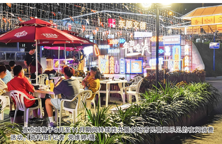
夜京城将于8月至11月期间持续性开展多场市民喜闻乐见的夜间消费活动。

在2022北京消费季·夜京城夜赏系列活动首秀暨北京城市联名卡首发仪式上,地铁“14号线商业带”项目宣布启动。据介绍,“14号线商业带”由朝阳区政府提出,联动14号线沿线及周边众多商圈提质升级,推动北部优化、南部提升,打造多点支撑、多业并举的“14号线商业带”。该构想提出后,北京京港地铁有限公司、沿线及周边商业和消费地图平台运营方北京量化派科技有限公司、北京华录高诚科技有限公司积极响应。为助力北京夜经济,“14号线商业带”将