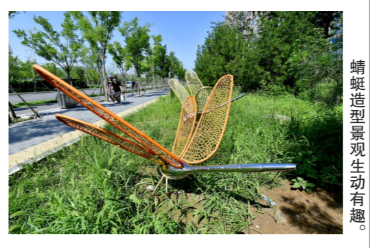
蜻蜓造型景观生动有趣。

“我就住这附近,自从建好了这座小公园,没事就来遛弯儿。”万盛南街一侧新建的口袋公园,吸引了许多市民。园内,环形步道穿梭于绿茵间,一旁的休闲座椅造型别致,七星瓢虫造型景观生动有趣。