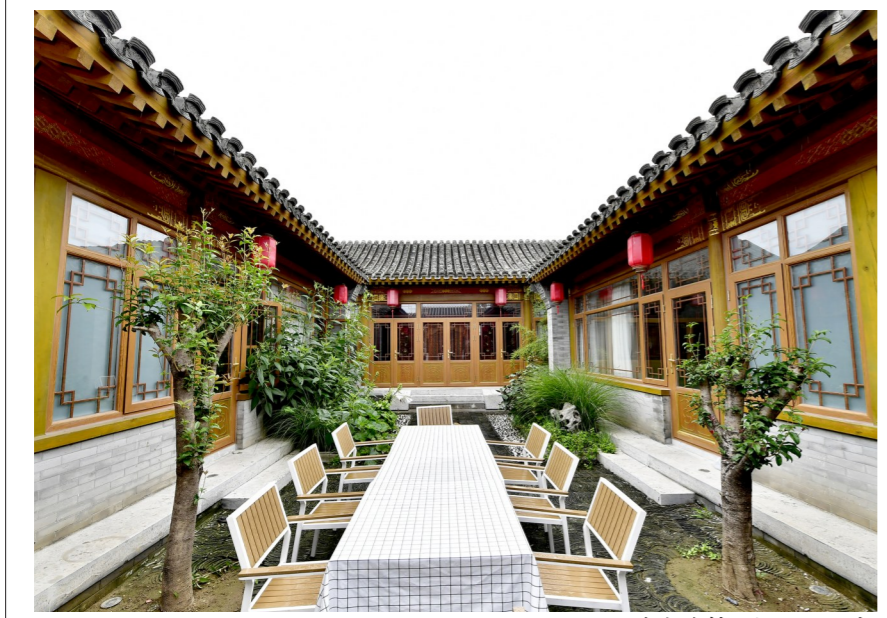
沙古堆村运河小院民宿