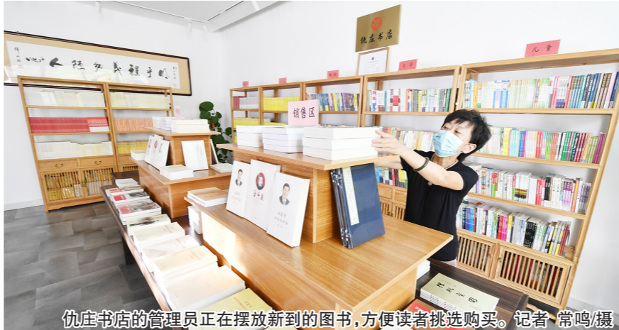
仇庄书店的管理人员正在摆放新到的图书，方便读者挑选购买。

仇庄村5.4公里外，永乐店镇柴厂屯村内的永乐咱家书城，同样受到了村里人的欢迎。柔和的光线充盈着整个空间，透过玻璃，原本昏暗的角落被照亮，书店也被衬托得更透亮、更纯净。这家书店经营面积超600平方米，其中图书营业面积超400余平方米，书籍种类丰富。考虑到农村地区文化设施相对单一，书店内还特别设计了众多服务区域，如小型阅览室、小型活动室等，致力于打造集阅读、休闲、讲座、文化沙龙于一体的综合文化空间。书店目前有经营类图书4000余种。“我们也希望为村里的孩子们提供更多精神食粮，即使不