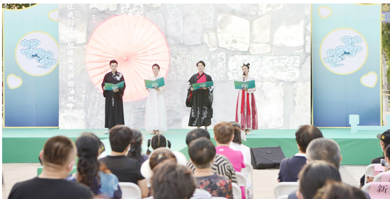
汉服表演秀、民俗非遗互动体验……昨天，丰富多彩的七夕节文化活动在运河畔拉开帷幕。

此外，具有代表性的北京非物质文化遗产“面人汤”和“北京兔爷”也来到了现场。非遗传承人用他们的手巧借“鹊桥之期”，展示超凡绝技，一个形象生