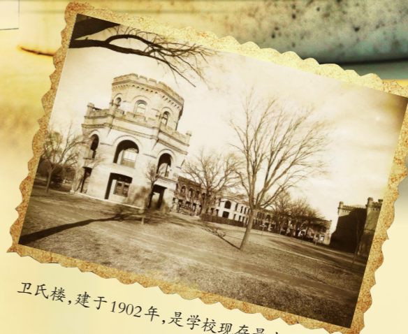
卫氏楼，建于1902年，是学校现存最古老的建筑。

后来，潞河书院先后更名为协和书院、华北协和大学，设大学、中斋(即中学)两部。1918年，其大学部迁到北京城内，与汇文大学等合并成立燕京大学；中斋部则留在通州原址，是为私立潞河中学。