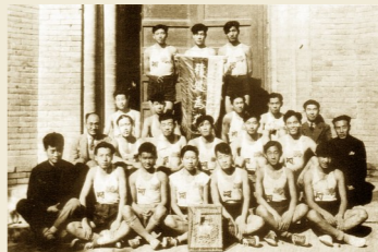
协和书院时期疏挖的协和湖，湖名沿用至今。