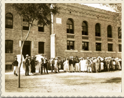
1922年，文氏楼落成。文氏楼内为礼堂，是学校举办文艺活动和会议的场所。