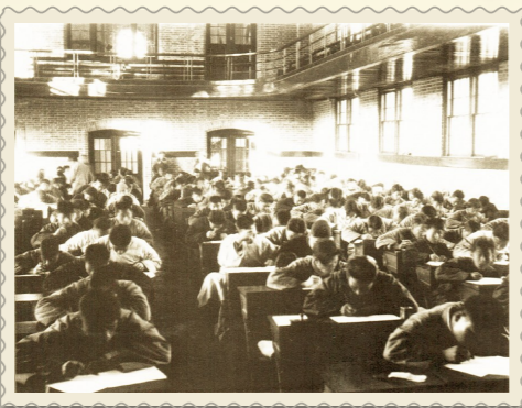
20世纪30年代，潞河中学的学生在考试。

1928年上任伊始，陈昌祐就把办学目标锁定成为国家富强、民族振兴服务，倡导“人格教育”，推行德、智、体“三育齐备”。他果断地取消了宗教必修课，增设了音、美、劳等课程，还组织学生参观工厂、医院，到泰山、曲阜孔庙等地游览，开拓视野。