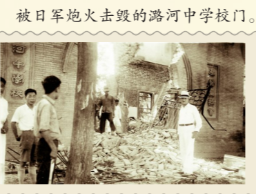
被日军炮火击毁的潞河中学校门。