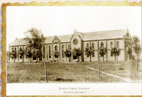
19世纪末的潞河书院。