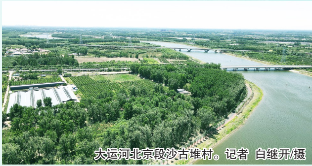
大运河北京段沙古堆村。