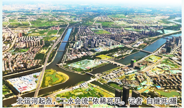
北运河起点,“二水会流”依稀可见。