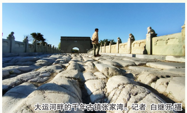
大运河畔的千年古镇张家湾。