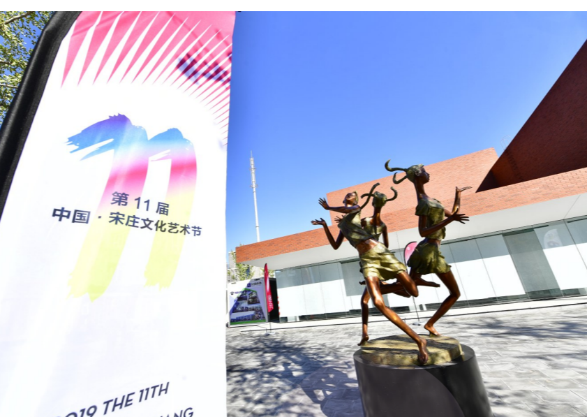
宋庄艺术创意小镇突出文化引领,聚焦文化创意产业,打造更具国际影响力的宋庄文化品牌。