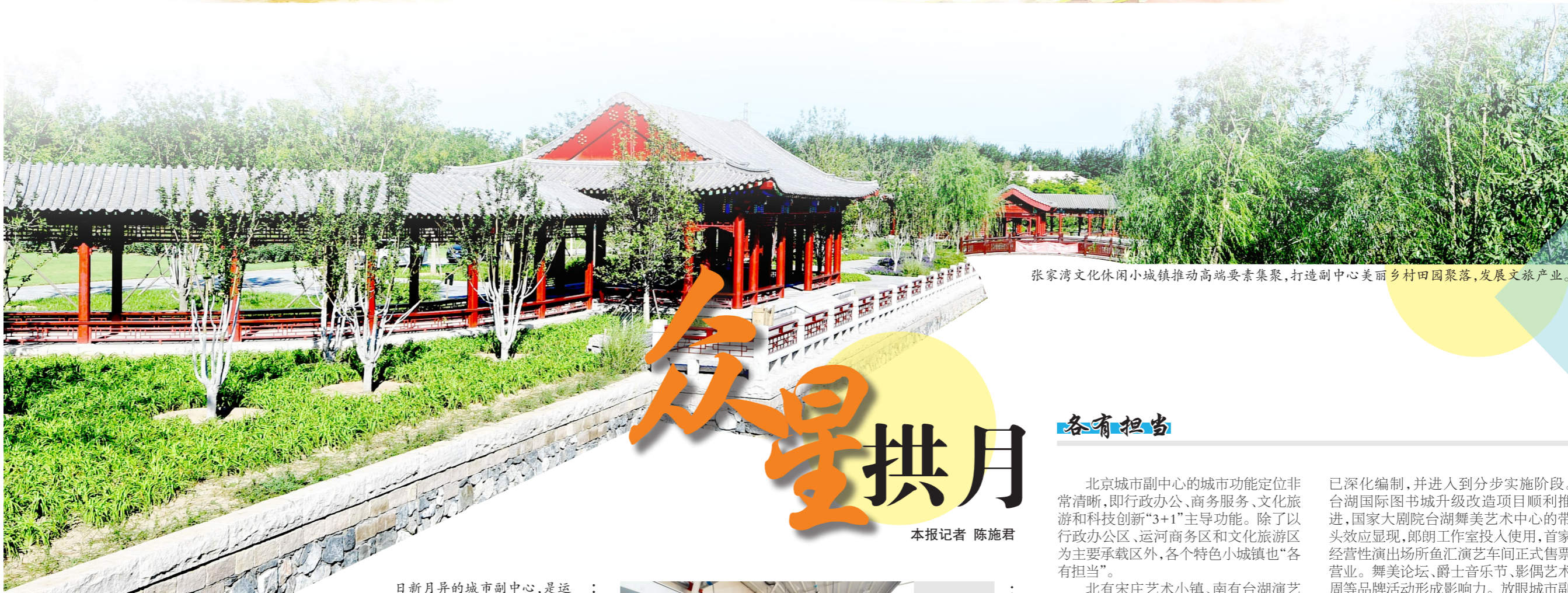
张家湾文化休闲小镇推动高端要素集聚,打造副中心美丽乡村田园聚落,发展文旅产业。