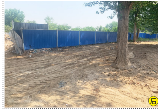
于家务回族乡神仙西路-垃圾渣土