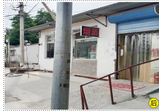
西集镇通香路粮油烟酒蔬菜水果店门前-堆物堆料