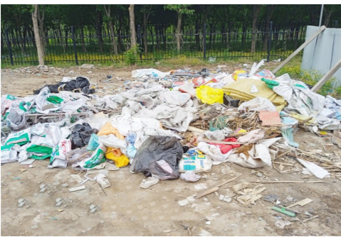
马驹桥镇陈各庄村西北747米-市级小卫星大型垃圾堆放点复发点位