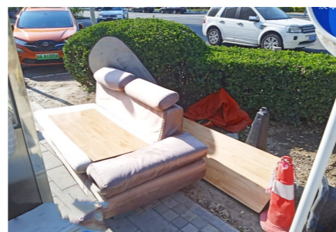
梨园镇群芳中二街北京农商银行西侧-堆物堆料