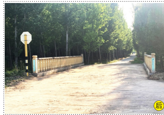
永乐店镇孔兴路与孔兴路交叉口西800米-积存垃圾