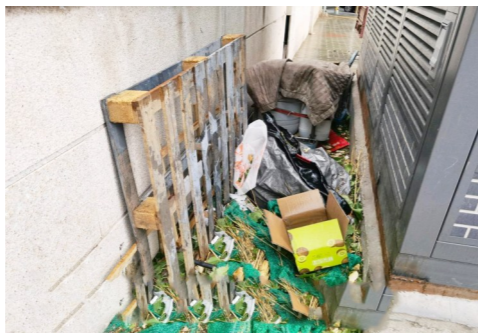
九棵树街道九棵树路与云景西路交叉口西南角-积存垃圾