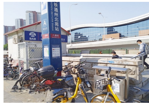
北苑街道北苑南路通州北苑地铁站A口-自行车乱停放