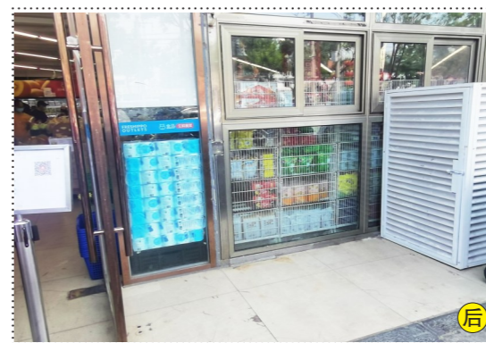
梨园镇云景东路盒马生鲜奥莱门前-堆物堆料