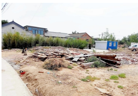
宋庄镇富家村村外空地-建筑垃圾