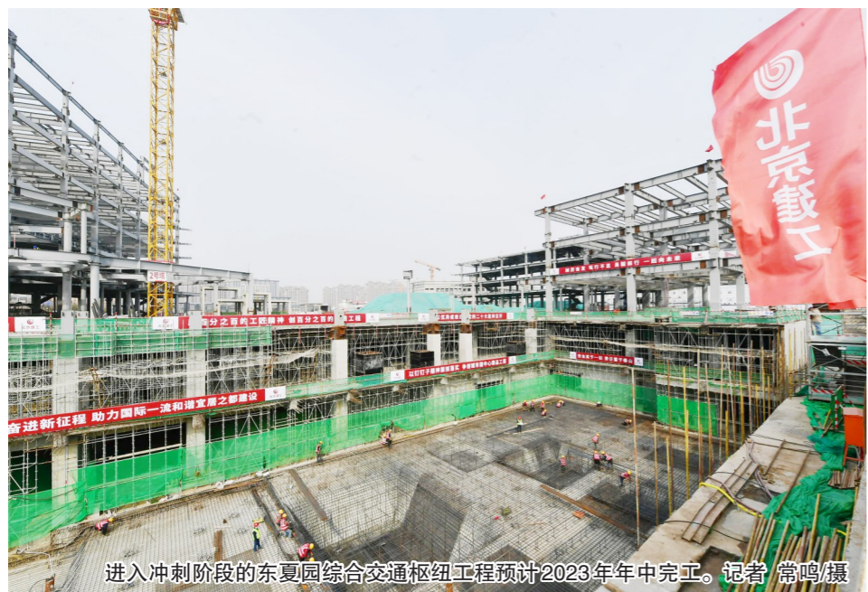
进入冲刺阶段的东夏园综合交通枢纽工程预计2023年年中完工。

在疫情防控的背景下,东夏园综合交通枢纽的工程进度正稳步推进。目前,该工程已进入冲刺阶段,地下结构已完工90%,地上结构已完工70%,其中1号楼和3号楼已经封顶。该项目正从严格落实各个环节的防控措施,保证工程正常推进。