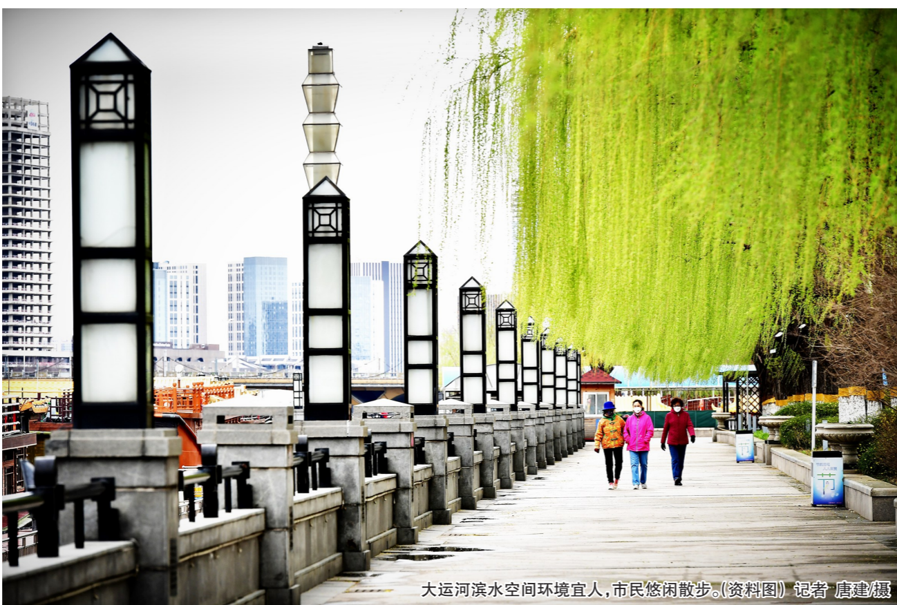
大运河滨水空间环境宜人,市民悠闲散步。

《导则》还根据河段所在区位、两侧滨水空间功能、河道资源特色,将河道划分为历史风貌型河道、公共活力型河道、自然生态型河道和一般型河道四种类型。