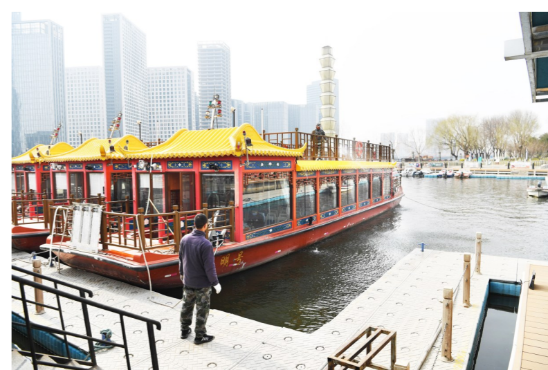
工作人员检修设备、清扫船体并消毒,为开航做好准备。

本报讯(记者 王军志)记者从京通大运河(北京)文化旅游管理有限公司了解到,该公司正在紧锣密鼓对所属100余艘小船和9艘大运河游船,进行开航前期的维修保养,为今年春季运营提前做好准备,预计3月底大运河游船可恢复通航运营,具体开航时间以该公司官方公告为准。