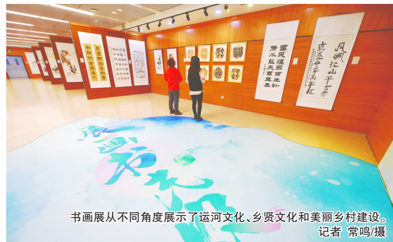
书画展从不同角度展示了运河文化、乡贤文化和美丽乡村建设。

本报讯(记者 张丽)丹青吐秀,墨彩飘香。近日,“绘国色神韵新风采·展美丽乡村新画卷”——美丽乡村新乡贤书画展在通州区图书馆开幕,展览截至3月15日结束。