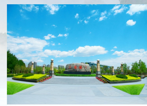
(通州区梨园镇政府发布)(田兆玉)(党维婷 贺建海/摄)