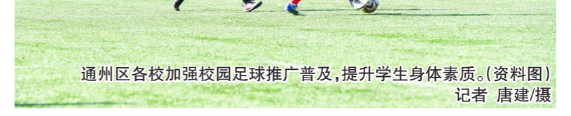
通州区各校加强校园足球推广普及,提升学生身体素质。(资料图)

本报讯(记者 张丽)近日,教育部公布2021年度全国青少年校园足球特色学校名单和2021年度全国足球特色幼儿园名单,通州区3所学校和11所幼儿园入选,至此,通州区共有23所全国青少年校园足球特色学校和22所全国足球特色幼儿园。