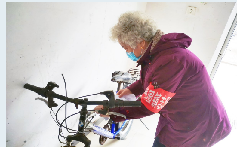
志愿者给废旧自行车贴上置换提醒。

解“两难”局面。社区工作人员结合日常巡查中掌握的废旧自行车情况,通过当面劝导车主和利用居民微信群宣传的方式邀请居民参与活动,根据自行车的新旧程度、型号、大小,给居民兑换相应数量的抽纸,并联系废品回收人员回收收集上来的废旧自行车。