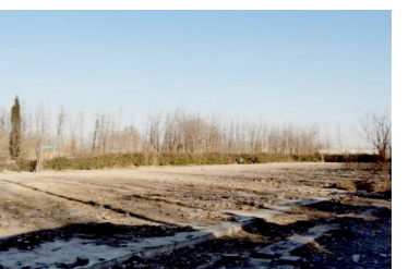
潮县镇马头村距马头外环路约35米