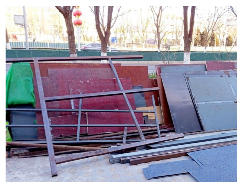
梨园镇云景南大街红日机车库周边一市级小卫星大型垃圾堆放点复发点位