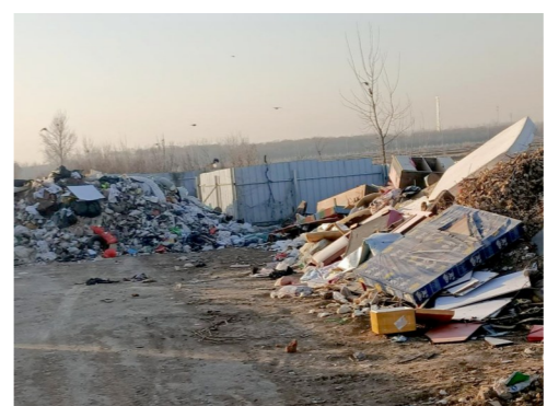
台湖镇玉甫上营距张台路约300米,距凉水河约1663米一市级小卫星大型垃圾堆放点复发点位