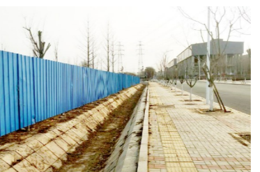
台湖镇农贸市场北侧-积存垃圾