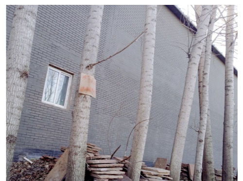
西集镇谢太路南侧50米-堆物堆料一市级小卫星大型垃圾堆放点复发点位