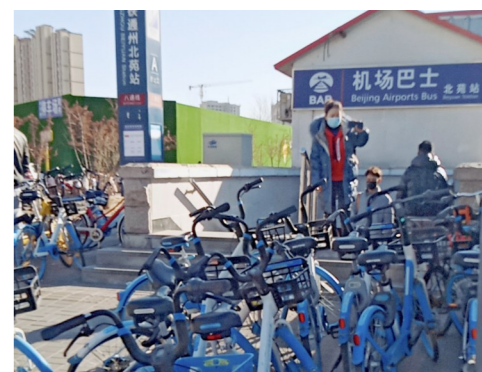
北苑街道北苑地铁站A口-互联网租赁自行车乱停放一市级小卫星大型垃圾堆放点复发点位