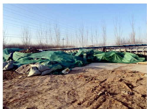
潮县镇张庄村距张京路约33米,距凤港河约609米一市级小卫星大型垃圾堆放点复发点位