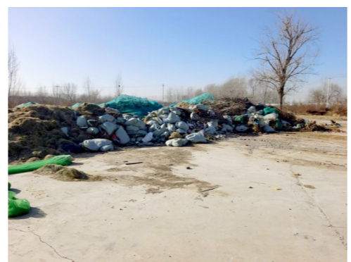
于家务乡王各庄村距张风路约95米,距永乐河约1585米一市级小卫星大型垃圾堆放点复发点位