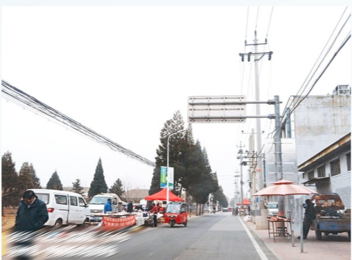
西集镇郎府任辛庄市场-占道经营