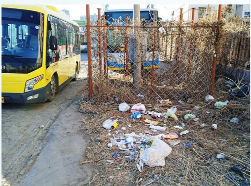
台湖镇瀛西路台湖演艺小镇西侧-绿地垃圾