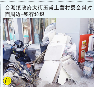
台湖镇政府大街玉甫上营村委会斜对面周边-积存垃圾