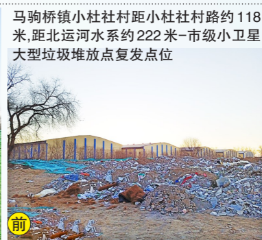
马驹桥镇小杜庄村距小杜庄村路约118米,距北运河水系约222米-市级小卫星大型垃圾堆放点复发点位