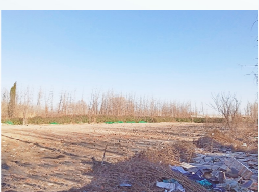
漷县镇马头村距马头外环路约35米-市级小卫星大型垃圾堆放点复发点位