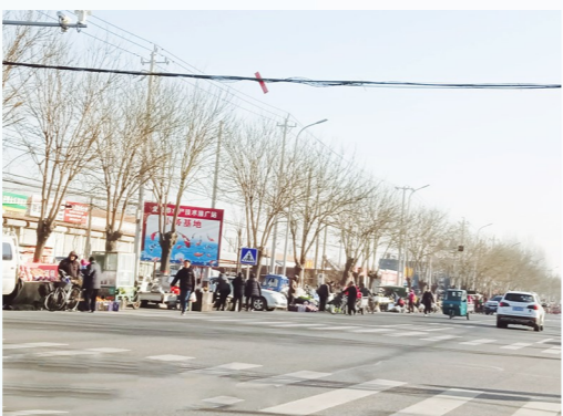
永乐店镇小务路小务村对面-占道经营