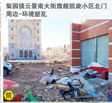
梨园镇云景南大街旗舰凯旋小区北门外-环境脏乱