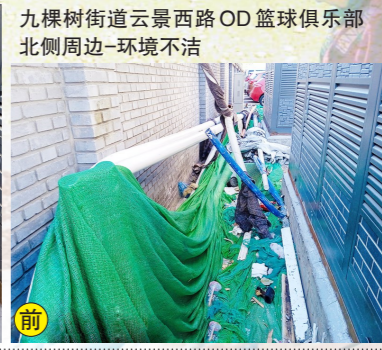
九棵树街道云景西路OD篮球俱乐部北侧周边-环境不洁