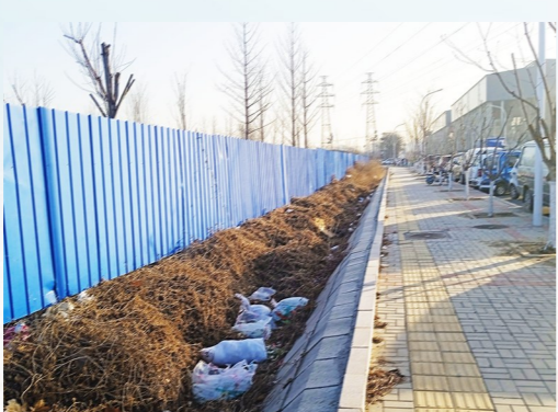
台湖镇农贸市场路北侧-积存垃圾