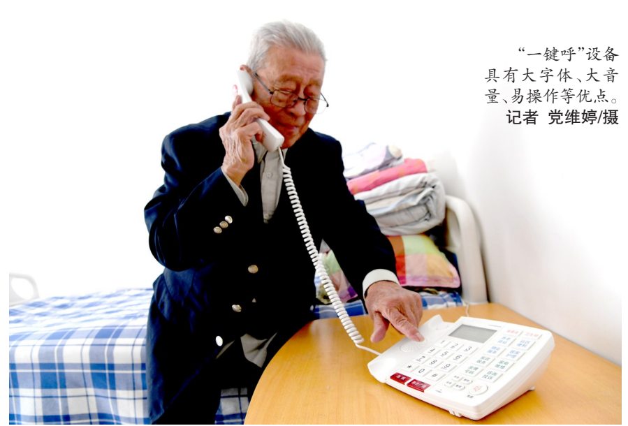
“一键呼”设备具有大字体、大音量、易操作等优点。

通过这部大字体、大音量的适老化“一键呼”设备,老人们不仅能一键按压“急救”直通120急救中心,还能一键直呼居委会、卫生站、养老驿站、物业服务、居家护理、家政服务、家电维修等多种养老服务,易操作,服务全,真正让老年人“一键在手,居家养老服务全”。