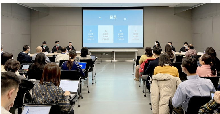
检察官为环球度假区工作人员授课。