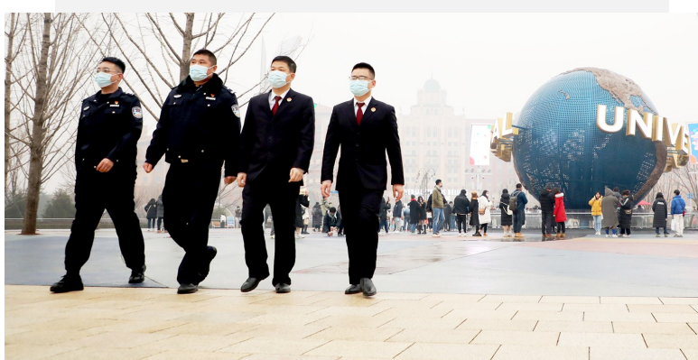
通州检察院与文景派出所联合执法。