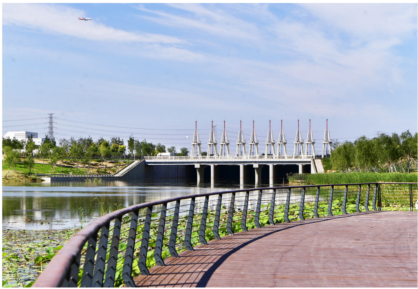
宋庄蓄滞洪区(二期)工程是集防洪、净水、观景、休闲于一体的综合性水利枢纽工程。(资料图)

记者获悉,相关部门也将做好工程收尾工作,按计划年底前全部完工,同时系统总结建设经验,加强运营管理,切实发挥防洪安全保障、水生态环境改善等综合作用,为市民提供开放共享的休闲活动场所。