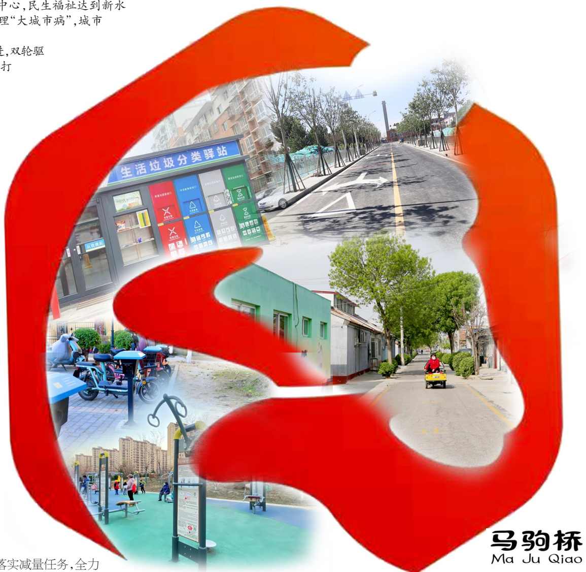
马驹桥 Ma Ji Qiao

今后五年,马驹桥镇将以高质量发展为主题,扎实推进土地开发和“十四五”规划落实;调整产业结构,确保引进和内生一批高精尖企业;加强基层治理,确保多元参与、共建共享;聚焦疫情防控和经济发展,确保两手抓、两促进,实现跨越式发展。