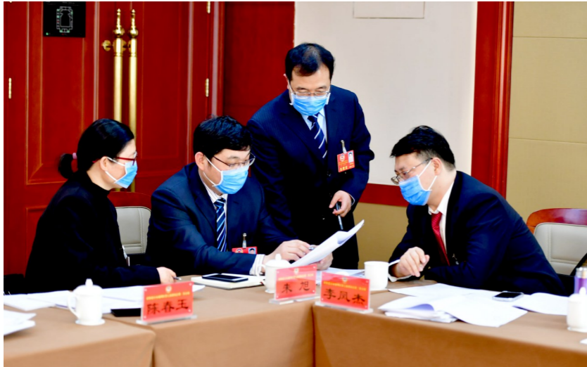
▲ 政协委员热议区政府工作报告 ▼ 区人大代表审议区政府工作报告

在今年的区“两会”上,出现了许多“新面孔”。新一届的代表委员,为城市副中心今后的发展提出了许多新的意见建议。