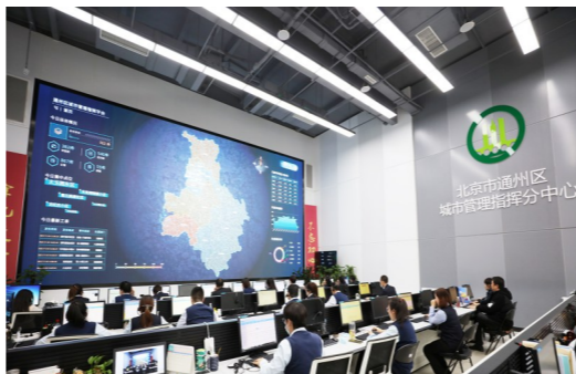
把接诉即办作为头等大事来抓。