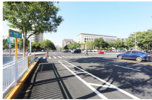
将“超薄磨耗层”国产新技术应用到市政道路建设中，延长道路使用寿命。