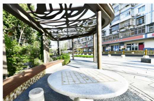
获评2021北京十大最美街巷的永顺中街。