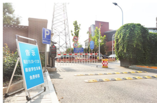
错时共享、限时免费，便民停车缓解交通拥堵。