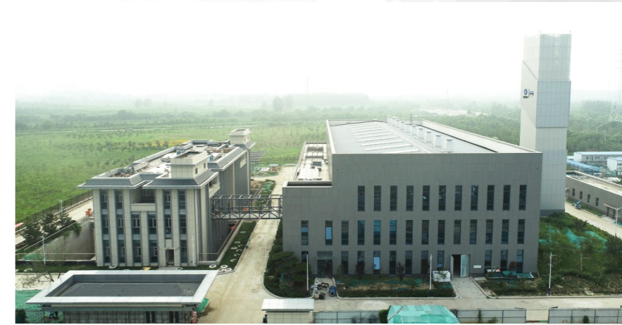
打造近零能耗建筑的河东5号智慧能源服务保障中心。

城市越发展，越要下足“绣花”功夫；城市管理越精细，群众的满意度就越高。作为城市管理、城市运行、城市保障的主力军，通州区城市管理委将继续从精细处入手，从群众关切的事做起，用好治理“绣花针”，“绣”出城市发展的亮丽图景，“绣”出群众期待的美好未来。