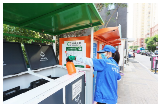
同时应用人防+技防方式助力垃圾分类工作。