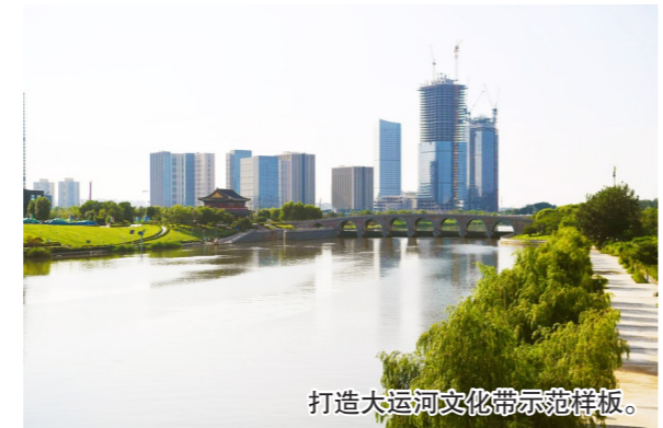
打造大运河文化带示范样板。

区党代会报告提出，今后五年，北京城市副中心将全力打造古今同辉、文旅融合的人文之城，聚焦“一区一河三镇”，以文化旅游区和大运河文化带建设为轴线，有机串联特色小镇和重要节点，打造京东旅游精品路线，以文旅发展聚人气、汇商气、显文气，展现古今同辉的人文盛景。其中，包括做优环球主题公园周边综合配套，启动文化旅游区北部地块和周边区域开发建设，利用好北京冬奥品牌，引进一批文化科技、演艺娱乐、冰雪体验等优质项目，辐射带动宋庄艺术小镇、台湖演艺小镇等特色小镇文旅产业联动发展。同时，传承历史文脉留住通州古韵，充分挖掘大运河丰富的历史文化资源，加快打造大运河文化带示范样板。建好大运河国家文化公园，创建大运河国家5A级旅游景区，实现大运河京津冀段水域旅游通航，积极推进通州古城、路县故城、张家湾古镇等区域保护修缮等。