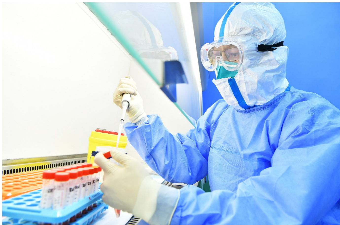
疾控人员检测核酸样本。