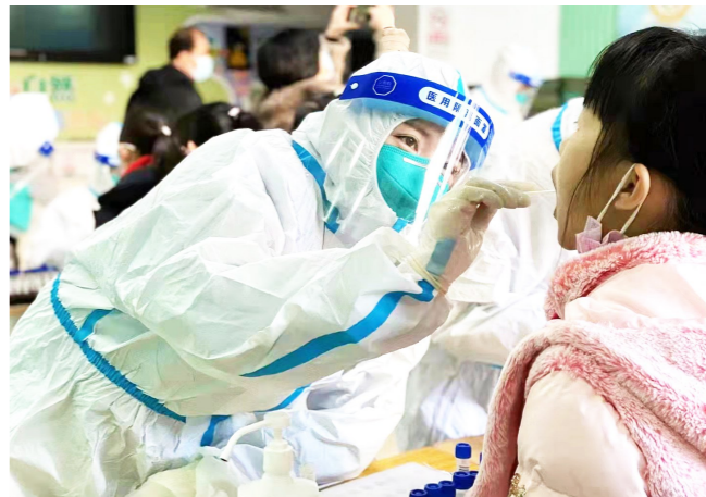
北苑社区卫生服务中心为儿童做核酸采样。