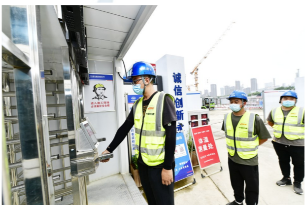
工地入口安装智能识别系统。