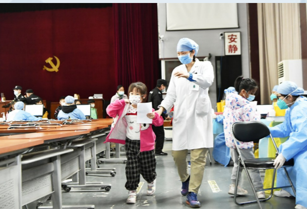
医务人员引导儿童接种疫苗。

从“白衣天使”到“白衣战士”再到“大白”，单纯的白色，如今又融汇了志愿者的蓝马甲、社区工作者的红马甲、民警的深蓝警服……“大白”和他的朋友们用更多色彩构建起城市副中心阻隔疫情的安全防线。寒潮渐起，这些冬日色彩为道道防疫阵线融入股暖意。