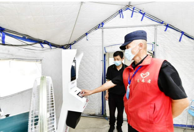
志愿者为居民接种提供服务。