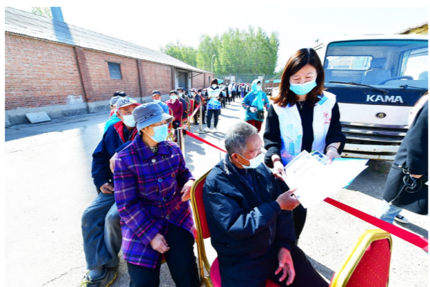
漭县接种点为老人们提供等候座椅。