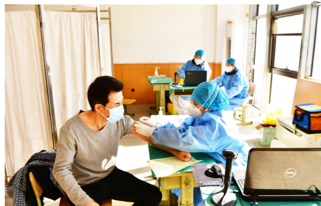
永顺接种点工作人员为居民接种疫苗。