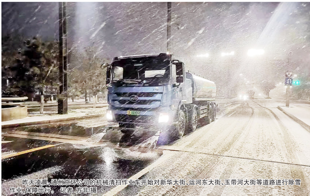
昨天凌晨，通州京环公司的机械扫雪作业车开始对新华大街、运河东大街、玉带河大街等道路进行除雪作业，保障出行。

据了解，通州京环公司主要负责通州区155平方公里范围内508条道路合计1358.29万平方米的扫雪铲冰任务，同时承担着城市副中心行政办公区、通州区文化旅游中心等重点区域的扫雪铲冰工作。截至目前，通州京环公司共有一线道路作业人员2800余名，道路作业司机300余名，公厕及垃圾站点保洁人员400余名，面对此次超乎预期的大雪，公司全体一线职工停休，尽全力做好扫雪铲冰。