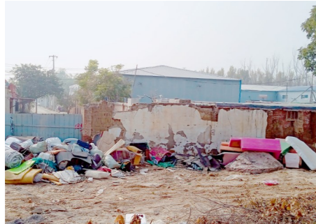
台湖镇蒋辛庄村距蒋辛庄村内路附近,距凉水河约2391米-暴露垃圾