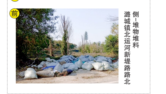
侧堆物堆料 潞城镇北运河新堤路路北