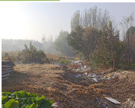
宋庄镇南环路沟渠阳光双语艺术幼儿园东160米-垃圾乱倒乱卸