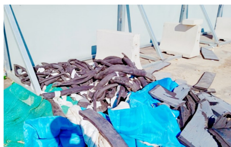
文景街道群芳南街与云景东路交叉口东南角周边-积存垃圾