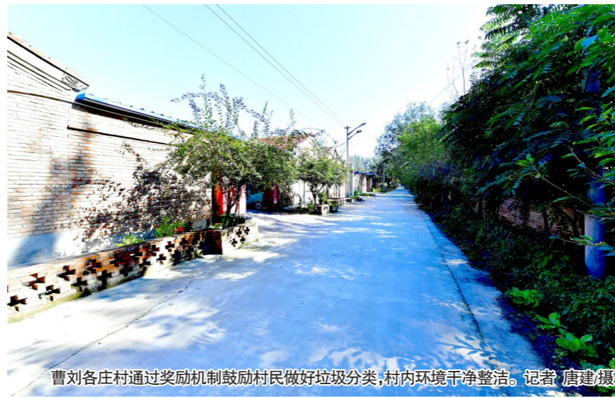
曹刘各庄村通过奖励机制鼓励村民做好垃圾分类,村内环境干净整洁。记者 唐建耀

各小区各有高招,各村各有好办法。在潞城镇东堡村,村委会给每家每户发放了一大一小的“套式”分类垃圾桶,让村民投放垃圾更干净、更方便。东堡村两委班子还组织村民参与垃圾分类知识竞赛,制作了垃圾分类卡,帮助村民提高垃圾分类意识,精准推