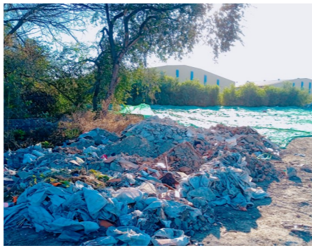
马驹桥镇小杜庄村距小杜庄村路约118米,距北运河水系约222米-垃圾乱倒乱卸