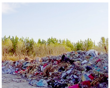
张家湾镇齐善庄村齐善路周边,距凉水河约544米-垃圾乱倒乱卸