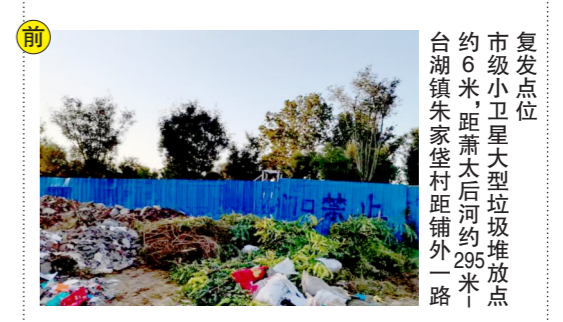
复发点位 市级小卫星大型垃圾堆放点 约6米,距萧太后河约295米 台湖镇朱家堡村距铺外一路