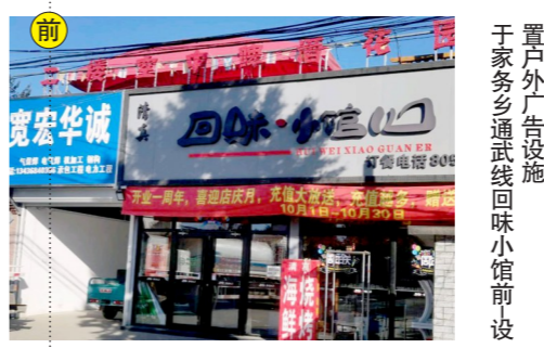
置户外广告设施 于家堡乡通武线回味小馆前设