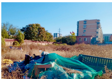
梨园镇云景南大街62号院甲9号附近26米云景南大街62号院西90米-垃圾乱倒乱卸

近期,区城市管理委结合农村人居环境建设工作,进一步加大对垃圾渣土无序堆放、垃圾清运处理体系不完善、环卫设施不健全、拆违区域不清地不净、围挡破损等影响村容村貌环境问题的检查力度,发现问题及时通知属地,并要求属地立时整改。请各街乡镇采取有效措施,紧抓不放,常抓不懈,有针对性、有计划、有步骤地整治清理辖区内卫生死角、盲区、顽疾、难点问题,并注重落实长效管理机制,着力构建共治共管长效机制,营造干净整洁、规范有序、舒适宜居的环境。