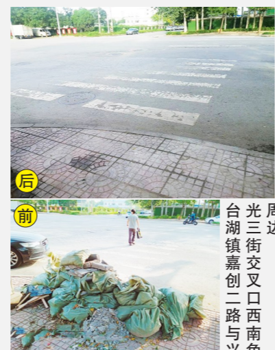
台湖镇光三街交叉口西南角