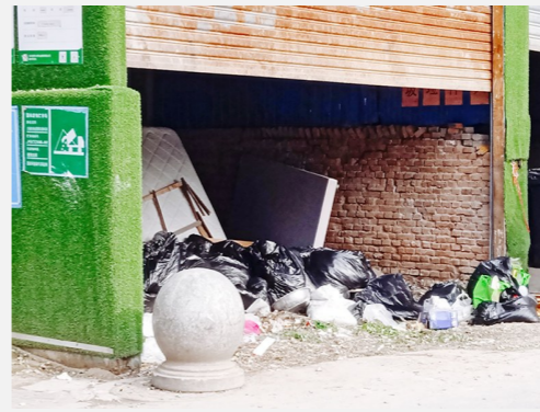
临河里街道净水东路东侧-堆物堆料