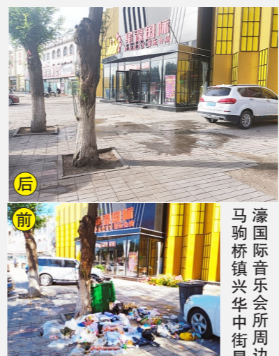
马驹桥镇兴华街中街星