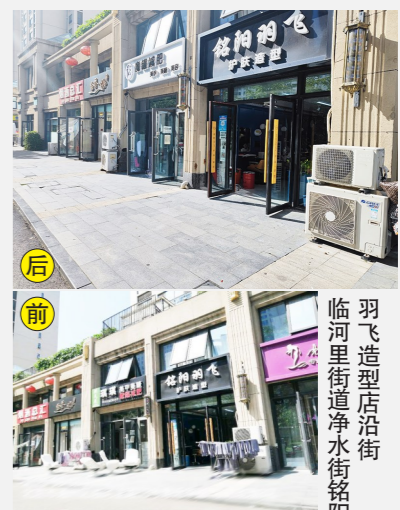
临河里街道净水街裕阳