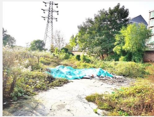
梨园镇环卫所北侧空地-垃圾渣土