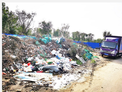
台湖镇朱家堡村-垃圾渣土