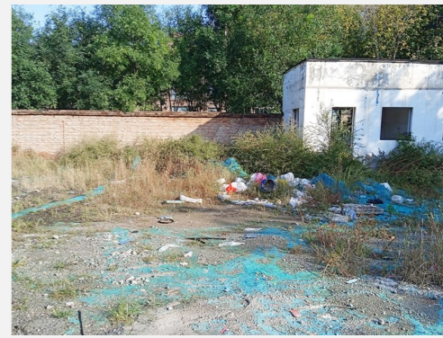
潘邑街道潞苑中路k2清水湾南侧-积存垃圾