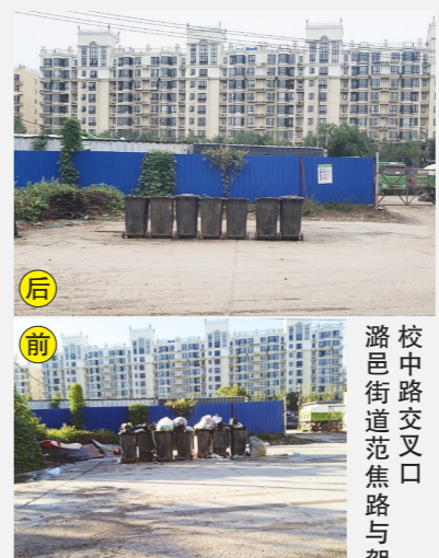
潘邑街道范焦路与驾