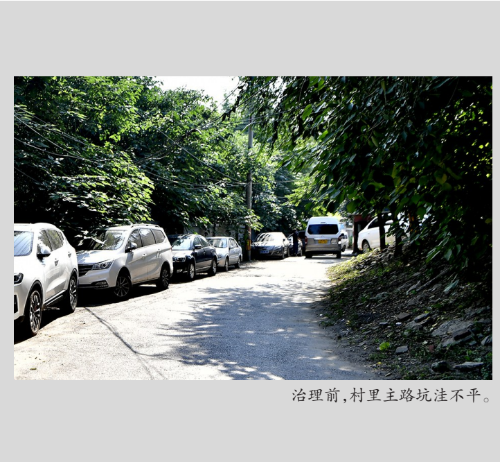
治理前,村里主路坑洼不平。

在东营前街和东营后街,经过此次环境治理也有了翻天覆地的变化。如今,坑洼土路被平坦整洁柏油路代替;以前路两侧一堆堆的垃圾不见了……据了解,为尽快还百姓干净整洁的居住环境,中仓街道组织数十名工人和五辆垃圾车齐上阵,用一个星期时间共清理200余车垃圾。柏油路铺设从开工到竣工仅用4天。“百姓特别支持。”据施工方负责人介绍,不少居民还自发加入了清理环境的队伍。