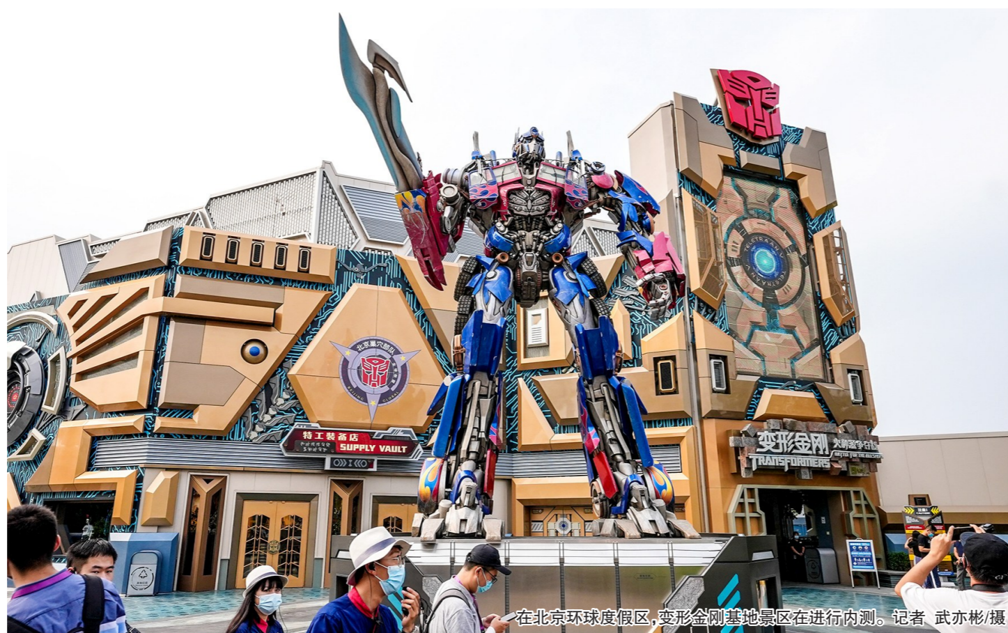
在北京环球度假区,变形金刚基地景区正在进行内测。

面对疫情防控常态化的形势,北京环球度假区与疾控部门保持紧密沟通,共同制定了周密的疫情防控计划,确保试运行期间每一位受邀客人及工作人员的健康和安全。园区运营的各个环节细致落实疫情防控的相关要求,包括入园客人健康筛查,强化园区各个场所的清洁和消毒工作,引导客人保持安全距离等多项举措。根据疫情防控要求,所有参与试运行测试的受邀客人需提前绑定身份信息,在主题公园入口处完成门票及身份核验,并出示有效的健康码,进行扫码测温,方可入园。同时要确保在游览过程中佩戴口罩、保持社交距离。“我们将密切关注疫情防控动态,及时根据疫情状况及试运行测试需要合理调整试运行安排。”北京环球度假区相关负责人表示。