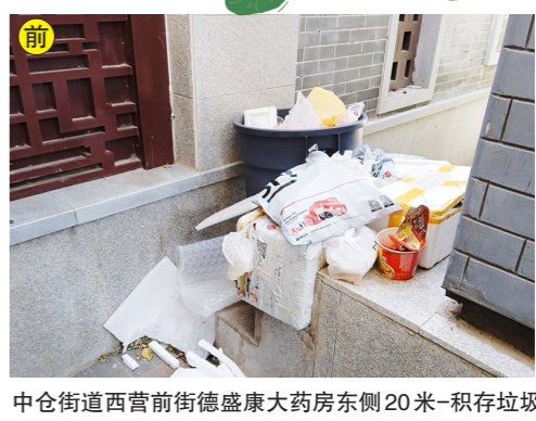
中仓街道西营前街德盛康大药房东侧20米-积存垃圾