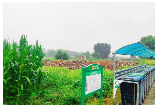
永乐店镇小务村东口-市级小卫星大型垃圾堆放点复发点位