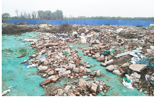
台湖镇碱厂村距西下营路约264米,距凉水河约510米-市级小卫星大型垃圾堆放点复发点位