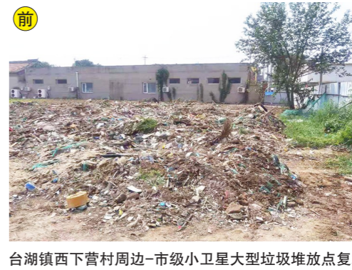
台湖镇西下营村周边-市级小卫星大型垃圾堆放点复发点位