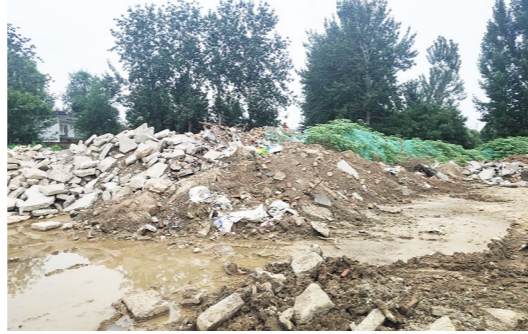
宋庄镇徐辛庄村距徐辛庄路约15米,距中坝河约1089米-市级小卫星大型垃圾堆放点复发点位