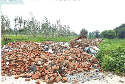
张家湾镇大辛庄村距张凤路约654米,距凉水河约2147米-市级小卫星大型垃圾堆放点复发点位