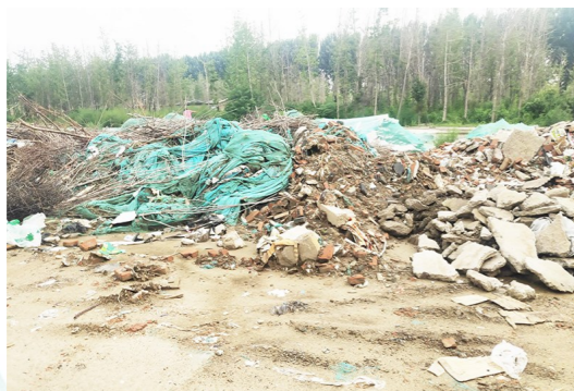
漕河镇马头村距马头路约60米,距北运河约1044米-市级小卫星大型垃圾堆放点复发点位