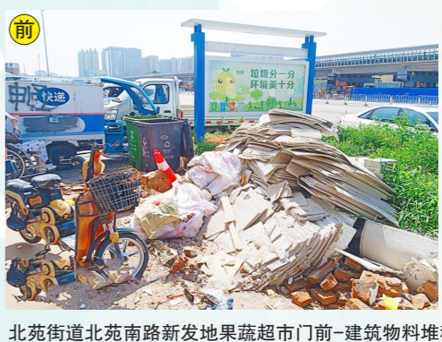
北苑街道北苑南路新发地果蔬超市门前-建筑物料堆积