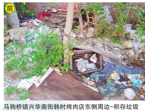
马驹桥镇兴华南街韩时烤肉店东侧周边-积存垃圾