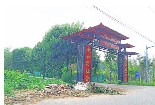
西集镇杜柳棵路小屯村村口-积存垃圾