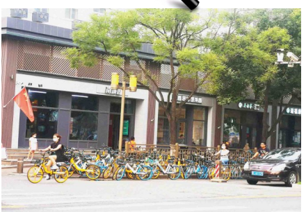
2. 昨天,北苑万达广场北侧人行横道附近共享单车乱停放。