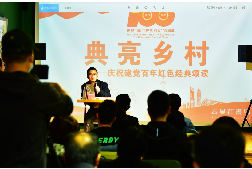
全区各实体书店开展形式多样的庆祝建党100周年主题宣传文化活动近400场。记者 唐建媛

本报讯(记者 张丽)“在北京大学工作期间,李大钊每个月收入240元,大部分都用于共产党小组经费和接济贫寒学生……”日前,《李大钊》《北大红楼》《新青年》三部红色原创连环画在咱家书房举行,书局负责人、原创连环画作者刘恩东沿着展架,一幅一幅向读者讲解。这是通州区实体书店举办的“红色经典 献礼百年”主题系列活动之一,自今年5月1日活动启动至7月底,全区各实体书店累计开展近400场,参与读者超过5万人次。