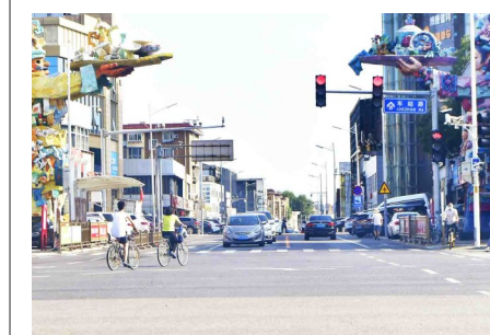
1. 昨天,新华东街与车站路口,个别骑车人闯红灯。