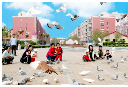
刘思利——梨园西屯村文化广场